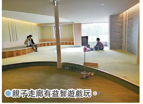
● 親子走廊有益智遊戲玩。

以「感受北海道大地的自然美景」為概念的星野 TOMAMU 度假村，早前推出眺望秋日廣闊風景的同時，亦讓大家可品嚐星野農場的乳製品的「農場下午茶」，大家可一邊眺望金黃白樺樹及悠閒生活於其中的動物們，一邊享用星野農場乳製品製作出的甜點以及鹹味小點心。而且，度假村內放牧着荷蘭乳牛、娟珊牛和瑞士黃牛，依據不同品種牛奶的特性選配適合的茶葉並提供奶茶，當天能夠喝到哪個品種的奶茶，就只有當天才知道！