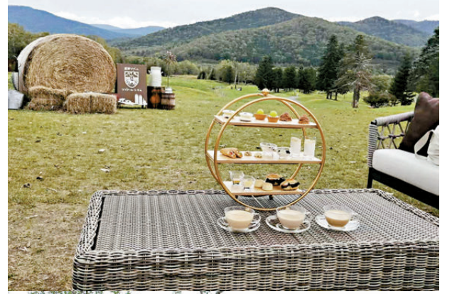
● 星野草場嘆下午茶