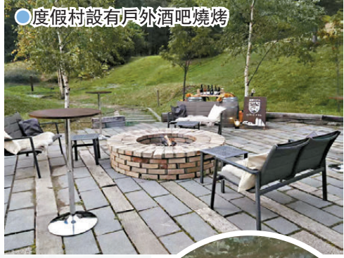
● 度假村設有戶外酒吧燒烤