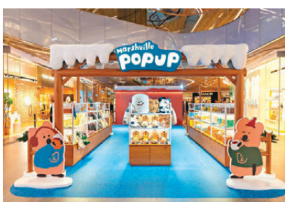
● DINOTAENG 官方快閃店

今個冬日，東薈城名店倉與韓國超人氣文創設計品牌 DINOTAENG 首度聯乘，由即日起至明年1月2日期間攜手打造全港首個東薈城名店倉 MEETS DINOTAENG 「Marshville's Winter」聖誕主題活動，與你歡度暖笠笠的聖誕節！當中，七大主題區域，有 BOBO 的甜蜜聖誕樹、繽紛雪橇大道、滑雪橇比賽、堆雪人比賽、冰上小木橋、極幻巨型木屋及 BOBO 頒獎台等，同時棉花糖村民還積極備戰「冬日冰雪棉花糖村」內進行的三項冬日活動，包括創意堆