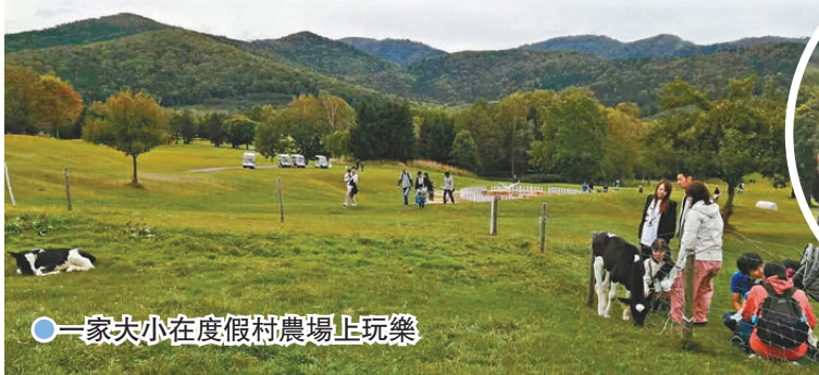
● 一家大小在度假村農場上玩樂