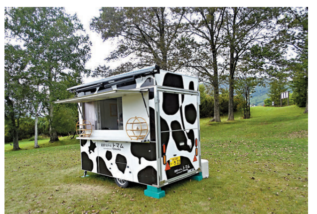
● 星野農場下午茶用自家產的牛奶做的蛋糕和飲品。