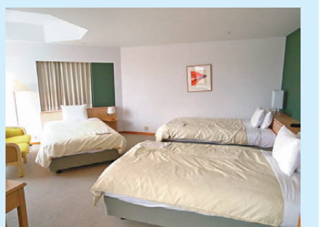
● 度假村酒店房間超大，適合一家親

位於星野 TOMAMU 度假村 RISONARE 大酒店的中央位置——Risonare，是星野集團旗下白金級的家庭型親子度假品牌，由2棟32層的雙子樓體組成，共有房間200間，每個樓層只作四間套房設計，讓房間面積達到奢侈的100平方米以上，房間內配備有淋浴室、桑拿蒸氣室，以及超大的山景按摩浴缸，由北海道的山景陪伴大家度過一段悠閒的度假時光。而位於32層的意大利精美餐廳，更可以一覽山谷全貌，無論是帶小孩的家庭親子旅行，還是情侶、親友之行，子入住。在這裏都能享受到大自然奢華假期時光。Risonare 整棟樓內都提供免費高速 Wi-Fi 服務，一樓還設有免費咖啡圖書館，以及售賣北海道高品質物產的商店。