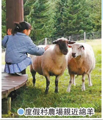
● 度假村農場親近綿羊

由12月1日開始至12月25日，度假村為大家準備了「農場聖誕節」，4米高的「農場樹」會豎立於充滿美食的 hotalu street，給大家打卡拍照；而每晚7點至9點，還有聖誕老人派發用 TOMAMU 牛奶製作的糖果。