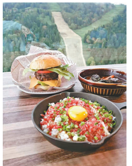
● 在 Grilled AGI 吃早餐，可看到滑雪場，美食也多選擇。

度假村內設有超過20間餐飲店舖，供應各種不同風味的料理，如森林餐廳 Nininupuri (精選日式自助餐)、阿茹 AHL (精選日式自助餐)、Yukku Yukku (意大利餐廳)、AL che-cciano (意大利餐廳)、三角 (日式料理)、普拉齊 (法國餐廳) 等，還有北海道餐飲名店街。當中，餐廳「OTTO SETTE TOMAMU」以北海道的節令食材為主，同時度假村內提供的美食選項應有盡有，例如可一次享用各種菜餚的自助式餐廳。當然，度假村的另一大特點便是滑雪商店「hotalu street」，以滑雪方式輕鬆進出街區，讓大家能在滑雪活動之間的空檔享用餐點，不論是快速補充能量的小點心，還是想好好放鬆享用正餐，都可以在此滑雪商店街內找到。