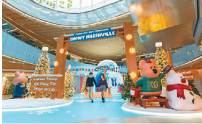
● 「Marshville's Winter」聖誕布置

雪人、冰釣挑戰，以及滑雪橇競賽！完成挑戰比賽後，各位短尾矮袋鼠家族的粉絲們切勿錯過全港首個「DINOTAENG 快閃店」，快閃店會分階段推出各式各樣 DINOTAENG 精品，2024年全新冬日釣魚盲盒及新品，由毛公仔、手提袋、文具到生活用品，款式應有盡有！