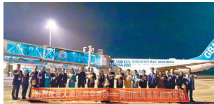
● 在黃山屯溪國際機場，一眾嘉賓熱烈歡迎首航班機。

據悉，大灣區航空將每星期提供3班（逢星期三、五、日）早上或下午自香港前往黃山的直飛航班，此舉亦是為大灣區航空開拓其飛行網絡的行動之一。