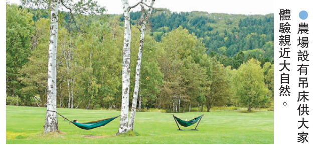
● 農場設有吊床供大家體驗親近大自然。