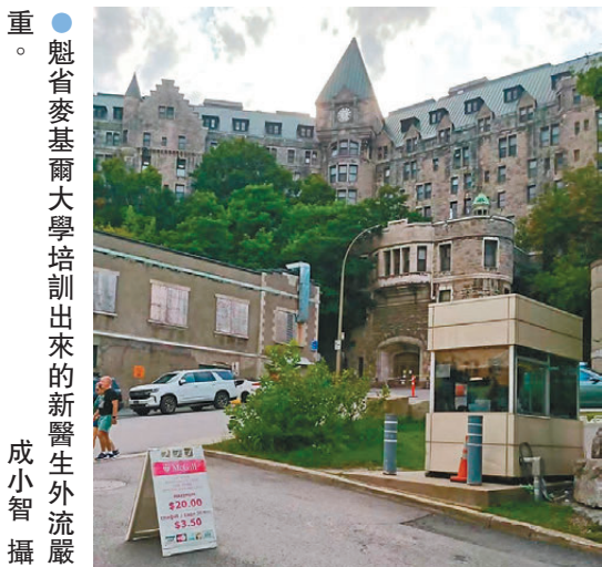
●魁省麥基爾大學培訓出來的新醫生外流嚴重。

衛生廳發言人11月表示，2015年至2017年畢業的2,536名醫科學生中，已有400名離開魁省前往其他司法管轄區行醫。目前，2,355名接受魁北克省培訓的醫生正在安大略省執業，其中1,675人畢業於魁省麥基爾大學。