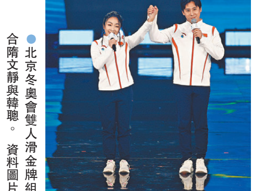
●北京冬奧會雙人滑金牌組合隋文靜與韓聰。資料圖片

香港文匯報訊 綜合新華社報道，中國雙人滑名將、北京冬奧會冠軍隋文靜6日在社交媒體上宣布復出，表示自己已恢復訓練。