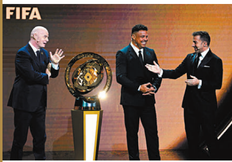
●國際足協主席恩芬天奴（左）、足球名宿朗拿度（中）和迪比亞路在抽籤典禮上，並展示新版世冠盃的獎盃。

皇馬剛戰西甲在麥巴比射失12碼下不敵畢爾包，在積分榜次席被多打一場的巴塞隆拿帶開4分，是役西甲作客本季「黑馬」不再的基羅納力爭反彈（Now632台周日凌晨4:00a.m.直播）。剛重返勝軌的巴塞則會作客聯賽兩連敗的貝迪斯（Now632台今晚11:15p.m.直播）。