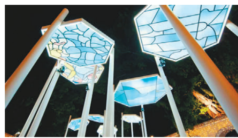
●互動裝置「Take a Turn」。澳門政府網站圖片

吳寧樂(上海)從事營銷與藝術跨界多年，專注觀念藝術與新媒體結合。她曾與來自西班牙及意大利等藝術家合作，今次與來自墨西哥的Sofia Castellanos合作，在氹仔區設藝術裝置「Dopamine」，作品猶如一幅三維畫卷，展現出蝴蝶翅膀的美麗圖案，彷彿將觀賞者帶入夢幻世界。