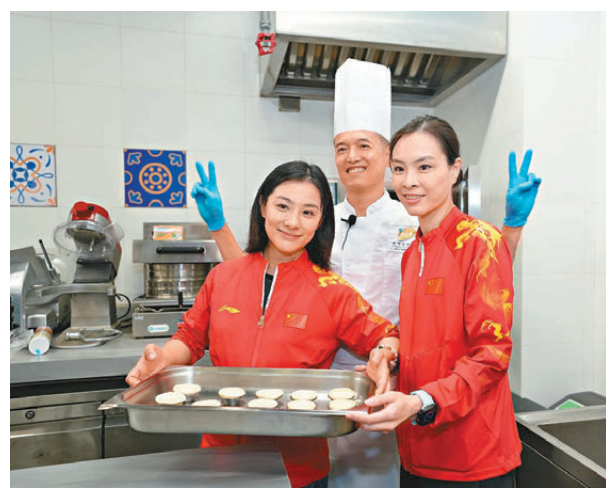
●國家金牌運動員體驗葡撻製作。