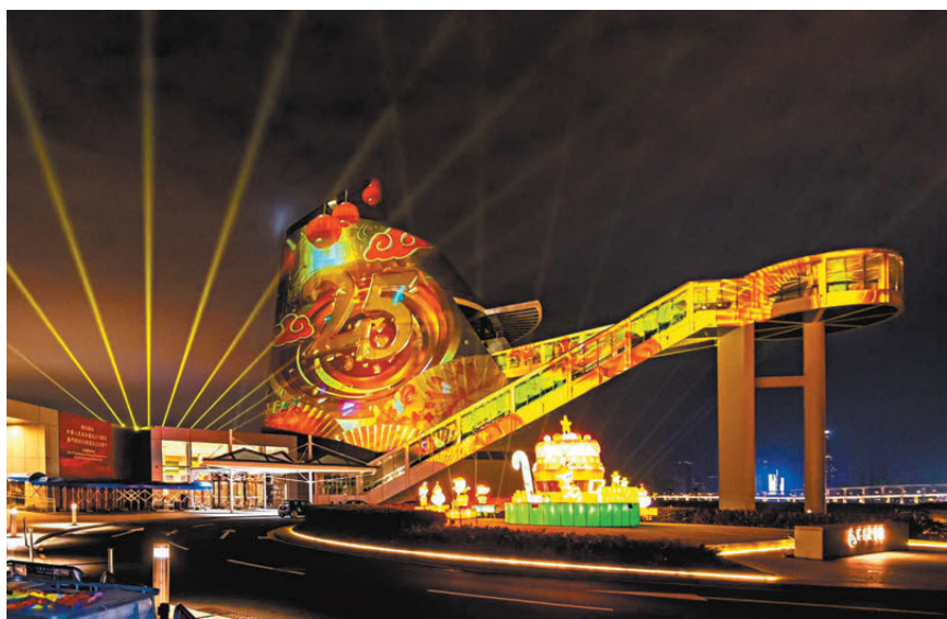
●HITOHATA, INC. 製作的光雕表演「Create the Future」。

HITOHATA, INC. (日本名古屋) 是日本一家數位創意公司，它透過投影映射、沉浸式博物館、數位裝置、3DCG動畫、VR/AR/Metaverse等數位內容分享情感和文化體驗。今次在澳門科學館前地上演以「Create the Future」為主題的光雕表演，分「當下之光」、「新生之始」和「歡慶之時」三個篇章，展望澳門的繁榮發展。