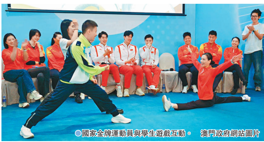
●國家金牌運動員與學生遊戲互動。

一眾國家金牌運動員又到訪勞校中學，與在場師生分享運動員心路歷程及奧運經歷外，也與學生及嘉賓一同參與遊戲活動，氣氛熱鬧。