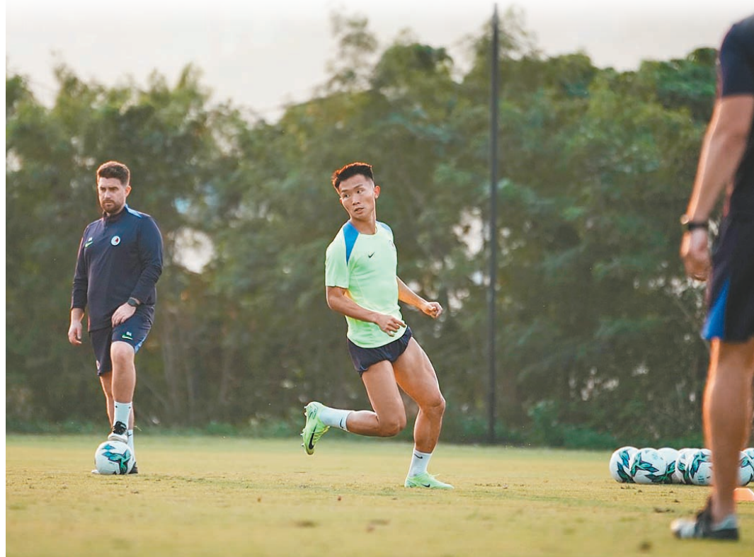
●港足球員積極備戰今晚比賽。

港足於「東亞外」與中國台北及蒙古同組，球隊將於今晚6時出戰首仗賽事迎戰蒙古。港足對上一次在主場出戰「東亞外」已經要數到2016年，當時由韓籍主帥金判坤領軍，球隊分別以3:2及4:2擊敗關島與中國台北，惟在最尾一場以0:1不敵朝鮮，無緣晉身決賽周。不過時隔8年港足已經有很大轉變，這些年間已經歷4任主帥(金判坤、加利韋特、麥柏倫、安達臣)，現時主教練則為韋斯活。韋斯活上任後一改以往踢法，現時更加崇尚控球在腳，取得球權後並不只是大腳向前，更多時利用短傳把足球送上前場。在韋斯活執教下，港隊進攻時將會踢3中堅陣式，由費蘭度任「自由人」的角色，負責串連及組織，而在防守時則會改踢「442」陣式。港足在過去3場友誼賽入7球只失1球，當中艾華頓更場場有入球，這要歸功於祖連奴經常走到右路與其做配合，替艾華頓引開對手後衛，現時艾華頓