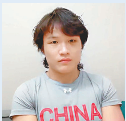
●張偉麗感謝粉絲支持。資料圖片

張偉麗通過視頻發表了自己的獲獎感言，「感謝大家投票將我選為2024年度最佳女子選手。感謝所有為我投票的粉絲。感謝《Fighters Only》的所有人。感謝我的每一位對手，今年是很棒的一年，明年會越來越好。」