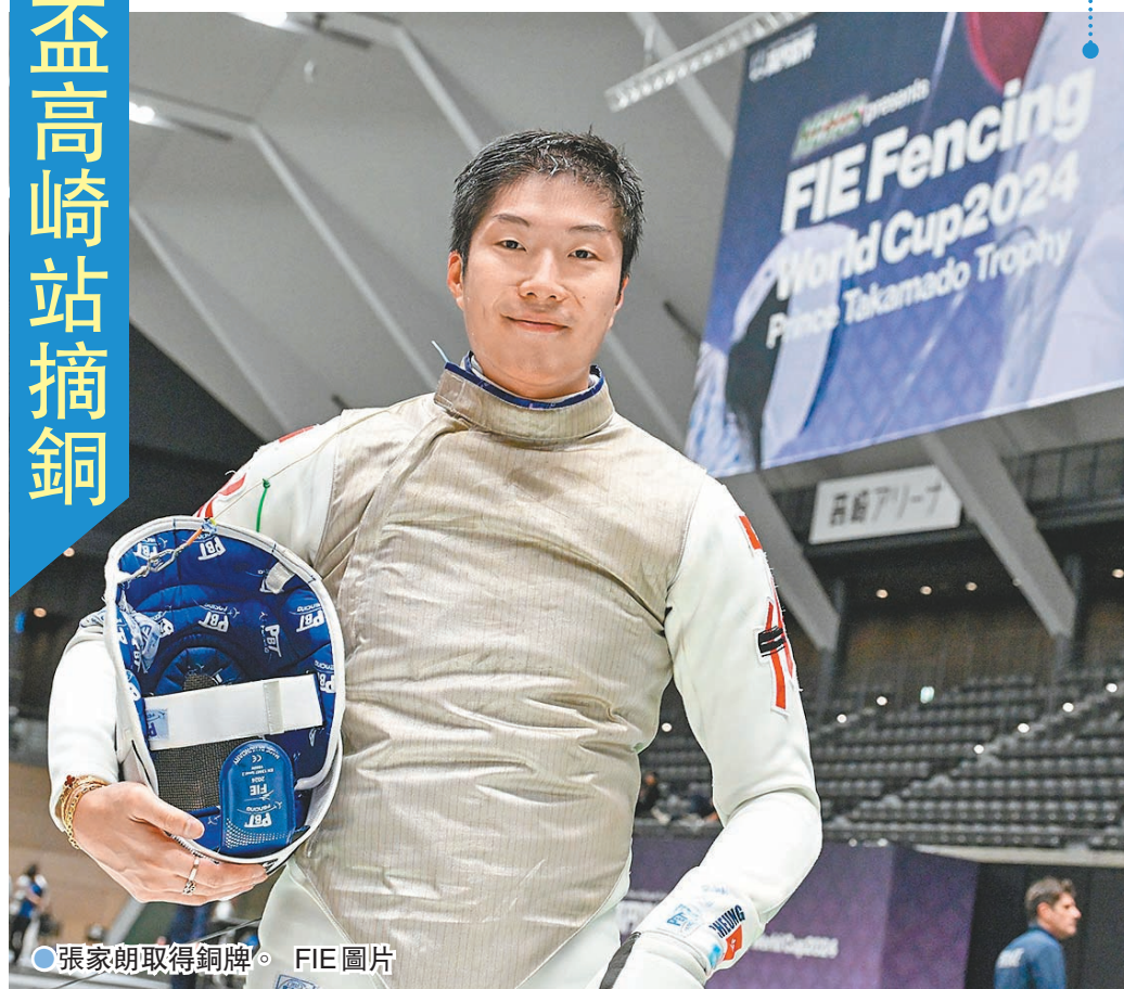
●張家朗取得銅牌。

張家朗其後先後擊敗美國及英國劍手，與馬奇會師4強，上演巴黎奧運決賽翻版。張家朗在第一節以7:9落後，最終「劍神」力拚之下仍未能扭轉敗局，以9:15不敵馬奇，在高崎站取得銅牌。張家朗今日將與隊友出戰團體賽。