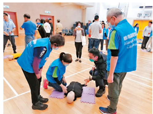
●東涌中關愛隊隊員及義工參與急救班課程。

此外，關愛隊還協助一名受上層污水渠問題滋擾的住戶，草擬信件向物業管理公司及相關政府部門求助。住戶通過關愛隊協助與物業管理公司溝通，收集居民意見和提供必要的證據，問題最終得到解決。該住戶對關愛隊鍥而不捨的服務精神表示非常感激：「有關愛隊真好！」