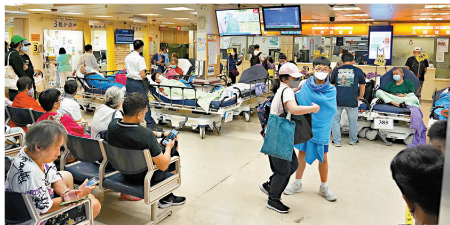
▲新冠病毒死亡個案上月底開始趨增，上月24日至30日的一周內已有3人死亡。圖為伊利沙伯醫院急症室非常繁忙。資料圖片