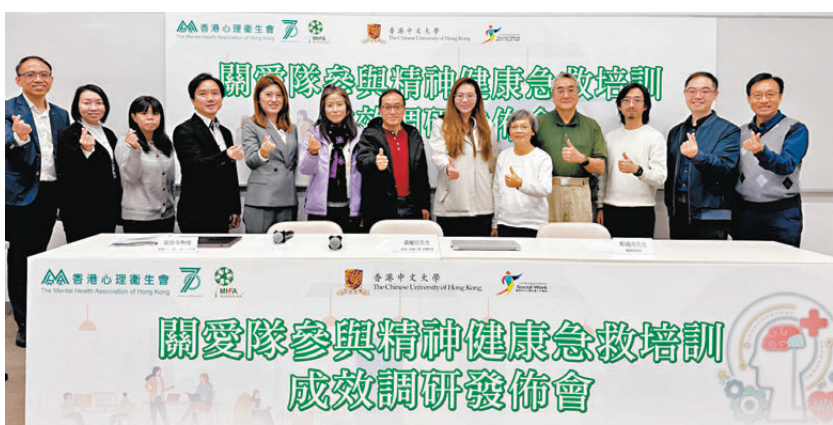
●調研指，參與課程的關愛隊成員在精神健康知識、對情緒病及精神病患者的接受程度及社區服務應用三方面均有顯著改善。圖為嘉賓合照。

香港文匯報訊 精神健康問題日益受到關注，香港心理衛生會與香港中文大學社會工作學系合作，於4月至6月期間為127名地區服務及關愛隊成員提供精神健康急救課程培訓。隨後，中大社會工作學系崔佳良教授團隊對課程成效進行調研評估，並於昨日公布調研結果。結果顯示，參與課程的關愛隊成員在精神健康知識、對情緒病及精神病患者的接受程度及社區服務應用三方面均有顯著改善，顯示課程對提升受訪成員在社區精神健康工作中的知識與能力具有積極作用。