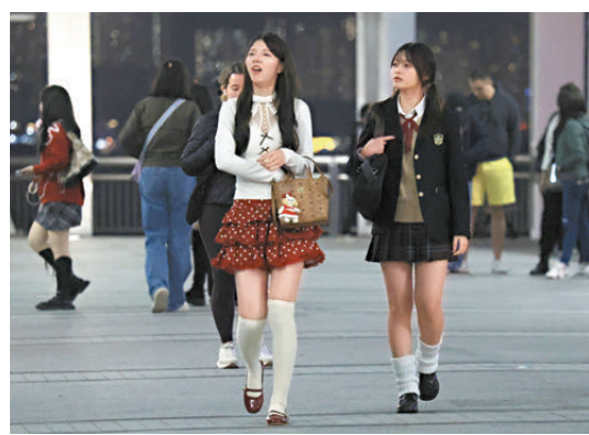
●昨日天文台錄得市區最低16度，是入冬以來最低紀錄。不少人紛紛穿上秋裝出行。

天文台預測，東北季候風今早上繼續影響廣東沿岸，氣溫介乎17度至21度，但季候風會在隨後一兩日緩和，該區氣溫逐漸回升，雲量較多，預測本週三(11日)市區氣溫日間升至24度。惟受另一股東北季候風持續影響，本週後期至週末期間華南沿岸氣溫再逐步下降，早晚相當清涼，漸轉天晴乾燥，風勢頗大。至周日(15日)市區最低氣溫會跌至13度，最高溫度18度，其後至下周一(16日)氣溫稍回升，下周二(17日)回升至16度至20度。