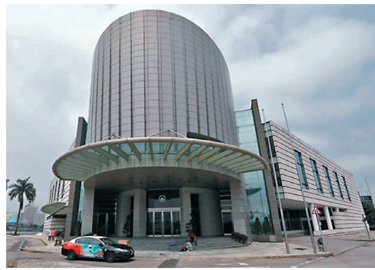
●高開賢表示，作為澳門特區的立法機關，澳門立法會一直堅守職責，做好立法與監督工作。圖為澳門立法會大樓。 資料圖片