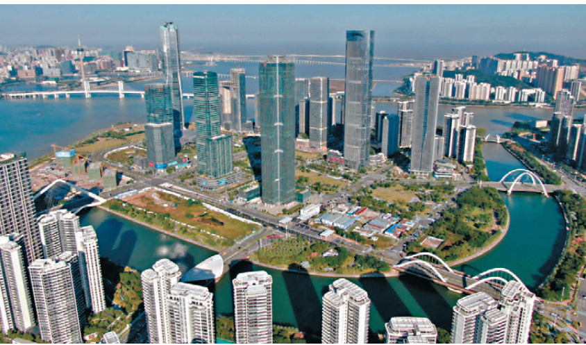
●橫琴金融島。 資料圖片