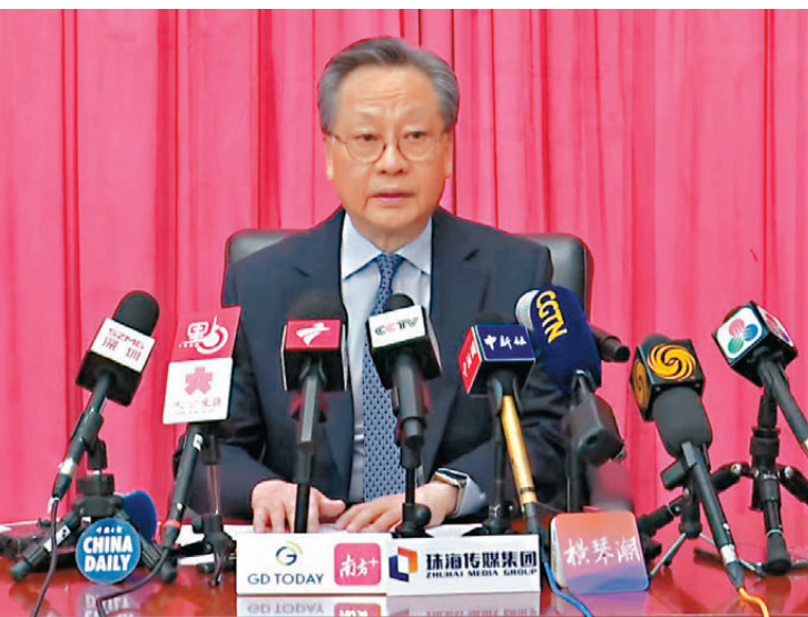
●澳門立法會主席高開賢接受媒體訪問。 視頻截圖