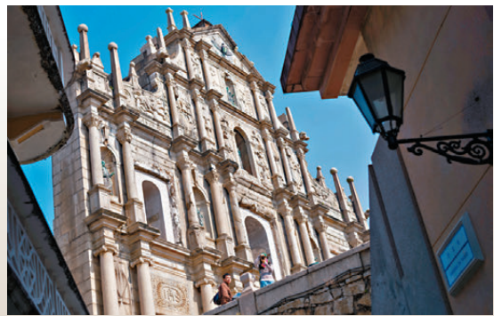
●遊客在澳門大三巴牌坊前拍照。

順着一縷清悠的茶香，便能邂逅一家百年老店。房樑上一塊略帶斑駁痕跡的木質招牌上寫有「英記茶莊」四個大字，店內空間不大，布置得古色古香，幾排整齊的貨架上陳列着普洱、鐵觀音、茉莉花茶等多種茶葉。「我們一直做平價好