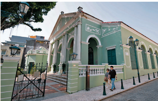
●行人從崗頂劇院前走過。

在澳門歷史城區，常常會與各式建築不期而遇，中國第一座西式劇院——崗頂劇院就是其中之一。劇院外牆以綠色粉刷，間以白色的飾條，再配以墨綠色的門窗及紅色屋頂，在崗頂前地一片以黃色為主調的建築中顯得獨立鮮明又不失和諧。劇院內部的裝飾簡約典雅，曾配備先進的舞台設備，是當時欣賞音樂會、歌劇和戲劇的主要場所。這座劇院在回歸後經歷過一次大規模修復，特區政府本着修舊如舊的原則保持了原有的建築風貌，是澳門文化遺產保護的典範。