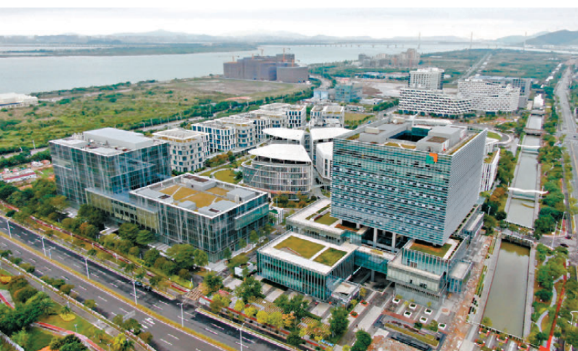
●橫琴粵澳合作中醫藥科技產業園。 資料圖片