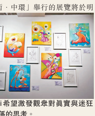
●Tachi希望激發觀眾對真實與迷狂藝術館也期待看之間關係的思考。到更多藝術家在元宇宙這一全新領域中，創造出更多令人震撼的藝術作品，共同推動藝術的邊界不斷向前拓展。

中呈現的最新藝術創作——「元宇宙」系列，讓人們深入探索了藝術如何捕捉並表達人類情感的極致——從現實的真實到心靈的迷狂，再到超越現實的元宇宙境界。這些作品不僅挑戰了人們對現實的認知邊界，更讓人们在迷狂之中感受到一種深刻的真實。它們或是對人類情感的深度剖析，或是對未來世界的浪漫幻想，或是對生命本質的哲學思考。在元宇宙的藝術表達中，真實與迷狂不再是相互對立的兩個概念，而是成為相互依存、相互轉化的動態過程。