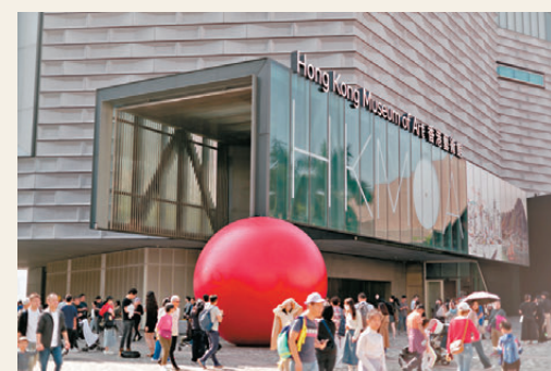
●紅球現身香港藝術館外。