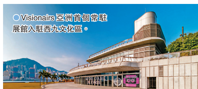
●Visionairs亞洲首個常駐展館入駐西九文化區。