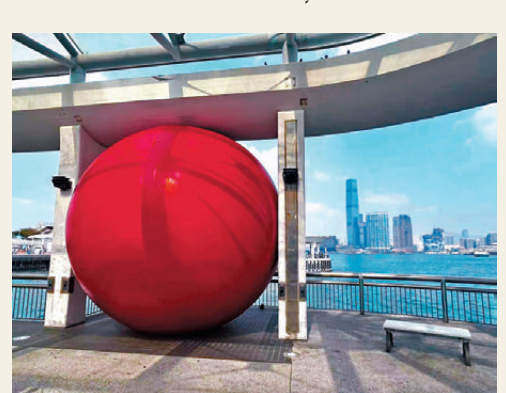
●紅球港巡展首個地點為中環10號碼頭。

作為「BODW in the city」的夥伴活動之一，「紅球巡展 香港」將持續至12月15日。每日上午11時至下午6時，這顆紅球都會被巧妙地「塞」進香港各個滿載文化意義的地標建築，同時進行免費展出，為大家帶來一連多日的精彩表現。藝術愛好者和途經市民，都可參與到這場別開生面的城市藝術盛會中，親身感受紅球帶來的驚喜。