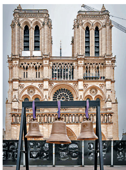
●今年11月還在修復中的巴黎聖母院。