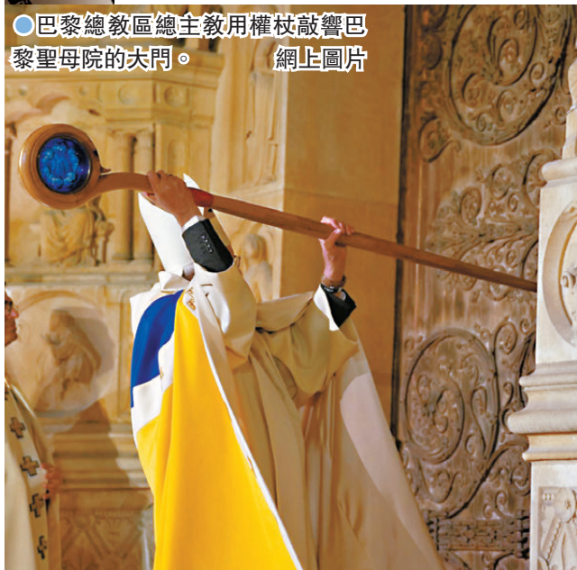
●巴黎總教區總主教用權杖敲響巴黎聖母院的大門。

2019年4月15日，一場大火將法國巴黎第四區西堤島的天主教堂——始建於1163年的巴黎聖母院的屋頂與塔尖燒毀，消息轟動全球。不少人為這座屹立