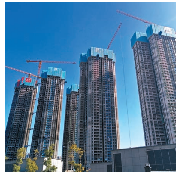
●今年以來，熱點城市土拍市場熱火朝天，上海、北京、成都、杭州、深圳、南寧等地相繼出現地王。圖為羅湖區一在建新盤。

克而瑞分析認為，土地市場局部有亮點，上海、杭州、成都等地優質地塊實現了高溢價成交，此外還在成都、西安等個別城市出現了民企高溢價投資拿地的個例。但不可否认的是，整體而言，土地投資持續徘徊於低迷區間，前十一個月仍有近五成投資處於暫緩態勢，而拿地金額TOP100中，央國企雖佔主導但拿地金額較同期下降36%。局部亮點出現主要是由於優質地塊的推動，受到高質量供地規模延續的影響，預計12月將繼續迎來大量高溢價優質宅地，而國央企依舊是核心城市的拿地主力。