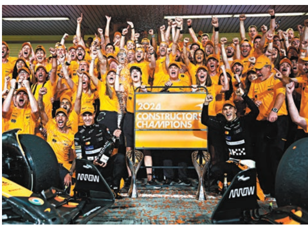
●羅里斯(開香檳者)為麥拿命車隊鎖定冠軍。