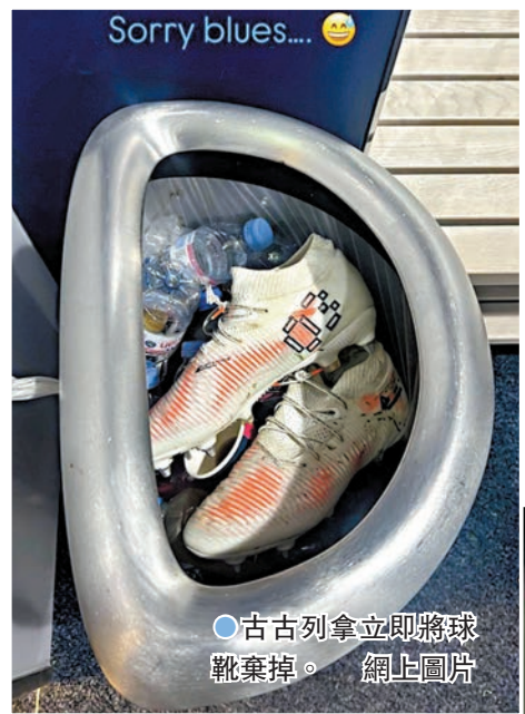
●古古列拿立即將球鞋棄掉。

同日阿仙奴雖然再憑角球入球，但仍只能逼和富咸1：1，錯失追近利物浦的良機。阿仙奴主帥阿迪達表示：「我們在比賽中做了我們要做的事，不幸的是在對方一次射門就失守。」