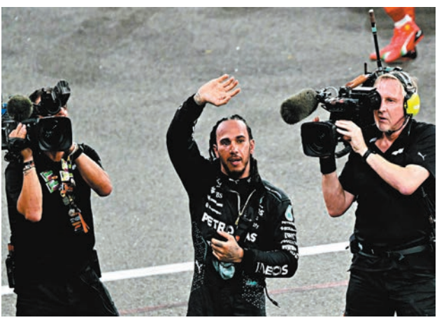
●咸美頓結束在平治車隊的12年時光。