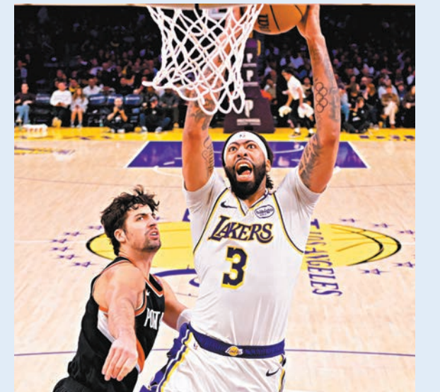
●安東尼戴維斯(3號)為湖人入樽得分。

香港文匯報訊 綜合外電報道，美職籃NBA常規賽昨日繼續進行，洛杉磯湖人在勒邦占士缺陣之下，依靠安東尼戴維斯送出30分和11個籃板，還有拉塞爾得到28分，主場以107：98擊敗波特蘭拓荒者，結束三連敗，暫時戰績為13勝11負。拓荒者則遭遇四連敗，成績暫為8勝15負。