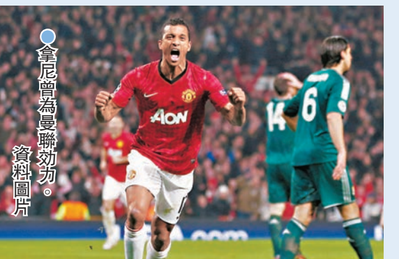
●拿尼曾為曼聯效力。資料圖片

香港文匯報訊 綜合外電報道，今年38歲的前曼聯和葡萄牙國足名將拿尼昨日通過社交平台宣布掛靴。拿尼2007年以約2,100萬英鎊的身價從士砵亭轉會至曼聯，之後為「紅魔」上陣過230場比賽，射入了40球，曾與C朗拿度在曼聯和葡萄牙隊作為雙料隊友，助曼聯贏得四次英超冠軍。可是發展不似預期，拿尼2015年離隊，之後到過土耳其、西甲和美職盃，但都未能重新證明自己，退役前回到葡萄牙超級聯賽效力。拿尼表示：「是時候向各位告別，我決定結束球員生涯。超過20年足球員生涯，充滿驚喜，我要多謝一路上支持我的人，經歷過高與低。時間上要我轉向其他的目標及夢想。」