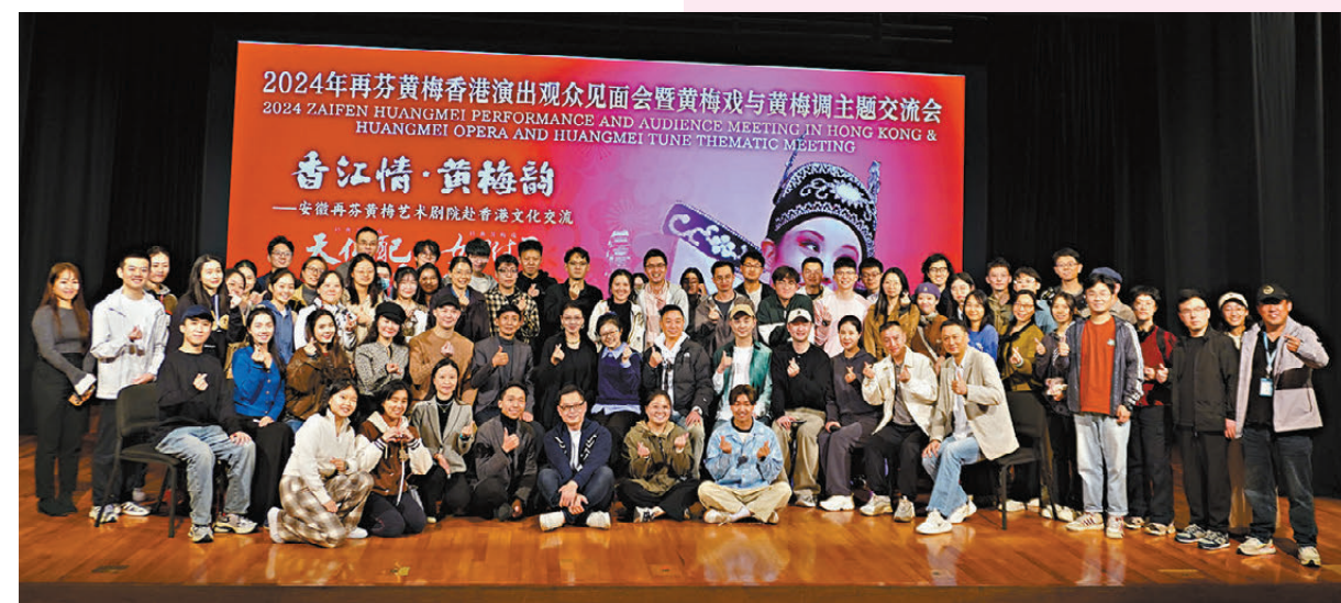
●再芬黃梅藝術劇院眾演員與現場觀眾大合照。