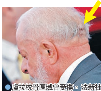
●盧拉枕骨區域曾受傷。

今年10月，盧拉曾在家中發生意外造成枕骨區域受傷。盧拉出院後繼續其日常工作，但被建議避免長途飛行，包括前往俄羅斯參加金砖國家峰會等活動。