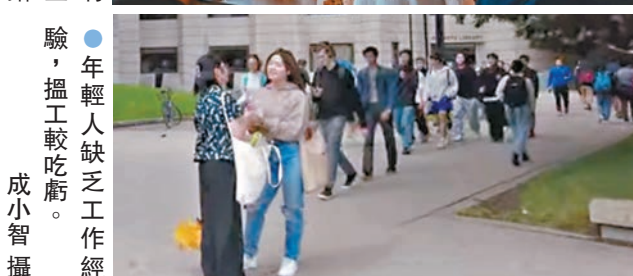
不少新移民填補空缺，餐飲業在疫後復工。年輕人缺乏工作經驗，搵工較吃虧。

突然大增根本是一枚「計時炸彈」，試問各地政府怎有能力一下子照顧大批新增人口。他指出私營部門最初聘用不少新移民，尤其是餐飲、製造和服務行業。隨著經濟普遍轉壞，各行各業今年趨向節流，裁員變成無可避免。