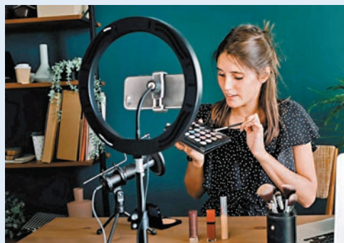
●TikTok封殺令將影響眾多依賴其營運的創作者。

香港文匯報訊 短片應用程式TikTok及其母公司字節跳動，周一（12月9日）向美國哥倫比亞特區巡迴上訴法院提交緊急動議，申請暫緩執行「封殺」TikTok的法案，等待美國最高法院審查。TikTok請求上訴法院在下周一，即12月16日之前就這項請求作出決定，強調若TikTok被封殺，美國中小企的利益都會受損。