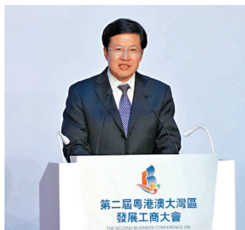
▲高雲龍致辭。