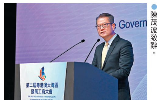
●陳茂波致辭。利營商環境和更龐大的商機。」陳茂波強調，有國家的堅實支持，只要大家準確識變、科學應變、主動求變，用好自身優勢，把握好機遇，大灣區工商界的前景一定會更加亮麗。