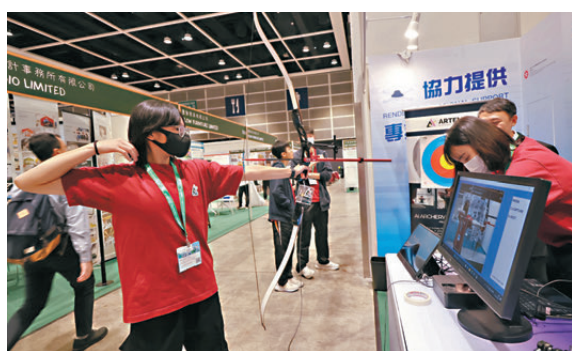
▲展商即場示範教學資源應用。