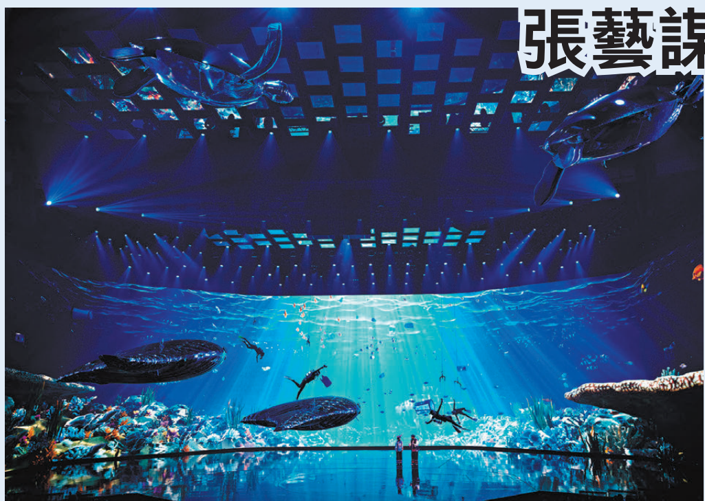
●張藝謀傾力打造的澳門全新駐場秀——《澳門2049》攜手二十個國際大師班底，結合升級的舞臺觀影及聲效設置。圖為美高梅於12月11號舉辦媒體優先專場。