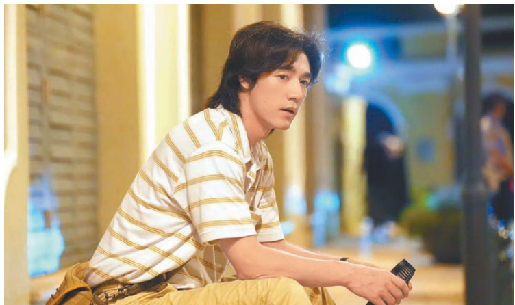
●內地演員此沙到澳門拍攝。