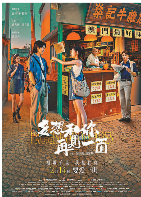
●電影《多想和你再見一面》後天獻映。

這兩部立足澳門人文歷史傳播的澳門題材影片，均由中國電影股份有限公司推出，冀以光影回望澳門回歸後的點滴故事，展示澳門發展的蓬勃活力與未來圖景，為澳門送上美好祝福。