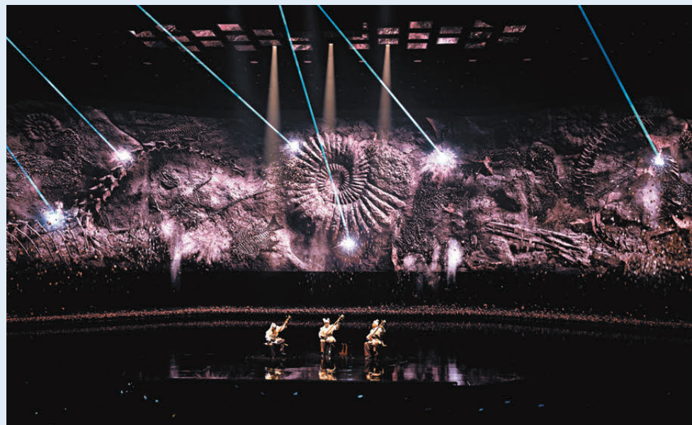
●澳門美高梅攜手中國大導演張藝謀傾力打造的澳門全新駐場秀——《澳門2049》將於12月15日美高梅劇院正式公演。

香港文匯報訊（記者鍾佩欣 澳門報道）為了慶祝新中國成立75周年以及澳門回歸祖國25周年，中國導演張藝謀打造的澳門全新駐場秀——《澳門2049》將於12月15日在澳門美高梅劇院上演，此秀攜手20個國際大師班底，結合升級舞臺觀影及聲效設置，讓八個中華非遺項目結合科技，以創新面貌匯合於多元文化共存的澳門。是次作品是張藝謀導演首個在大灣區親自執導的駐場作品，張藝謀表示，適逢今年是雙慶之年，歷經時代風雲洗煉，澳門依然生命韌勁十足，一邊連著世界，一邊連接文化母體之根，煥發新的能量。《澳門2049》將東方與西方的文化進行融合，張藝謀期望向世界呈現不一樣的澳門面貌。