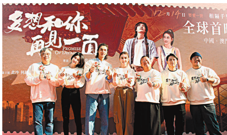
●《多想和你再見一面》劇組日前出席在澳門崗頂劇院舉行的首映禮。