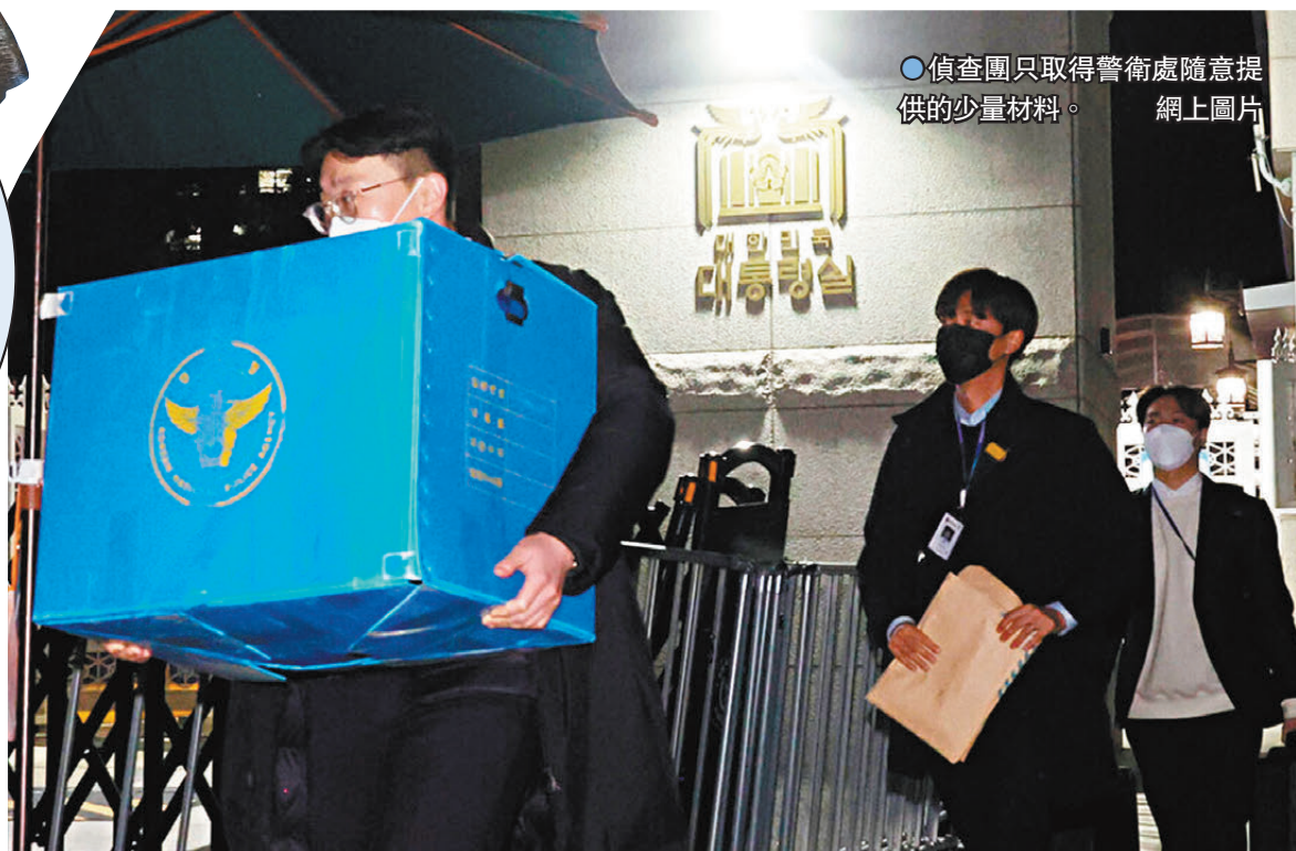
偵查團只取得警衛處隨意提供的少量材料。