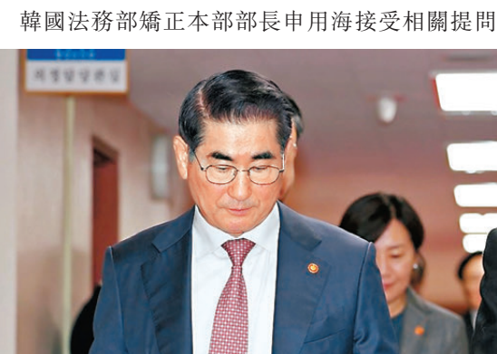
韓國法務部矯正本部部長申用海接受相關提問

香港文匯報訊 韓國前國防部長官金龍顯（圖）已被拘捕，成為今次戒嚴風波首名被捕人員。韓國懲教機關高級官員周三（12月11日）表示，金龍顯在被捕前不久，曾在首爾東部看守所內，企圖以衣服於廁所內自殺。