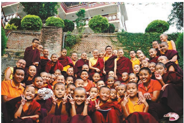
●一個關於愛、勇氣和寬恕的故事，見證了「搖滾女尼」的傳奇人生。

影片體現了我們對於「生」的思考。這些年的拍攝，我們體驗到一種溫柔的力量，像水一樣的柔和：不能立刻天崩地裂，但卻能滴水穿石。這也是我認爲女性身上的一種力量——那種溫柔柔拈花一笑的感覺，時間再久都能撐得住，影片最後呈現的就是這種生命的美學。」