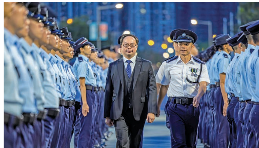
●2024年5月10日，方俊文於香港輔警總部舉行的香港輔助警察隊沙田警區輔警周年進修訓練結業會操典禮上主持檢閱儀式。