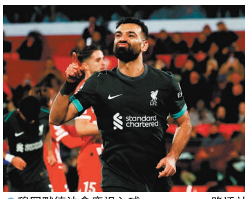
●穆罕默德沙拿慶祝入球。

平，換邊後不久雲尼斯奧斯祖利亞禁區內半轉身射入，加上比寧咸建功，皇馬領先到3：1，阿特蘭大雖由盧卡文扳回一城，但還是未能挽回敗局。皇馬主帥安察洛堤表示，這場勝仗對一度居於出局邊緣位置的皇馬尤其重要：「這場勝仗帶給我們很多，這是偉大的勝利，它是高質量的表現和努力的成果，給了我們一些喘息空間……」