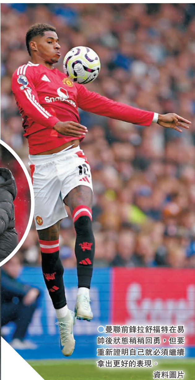
●曼聯前鋒拉舒福特在易帥後狀態稍稍回勇，但要重新證明自己就必須繼續拿出更好的表現。

曼聯此行作客遇上這支位居捷克甲組聯賽次席的球隊，要穩守未必容易，艾帥或會先求盡量多入波搭狗。除了海倫，艾帥亦希望拉舒福特可重拾穩定的入球率，近日有傳聞指曼聯明年或會考慮將拉舒福特出售，以改善財務壓力，「福仔」必須拿出更好表現來為前途而戰。