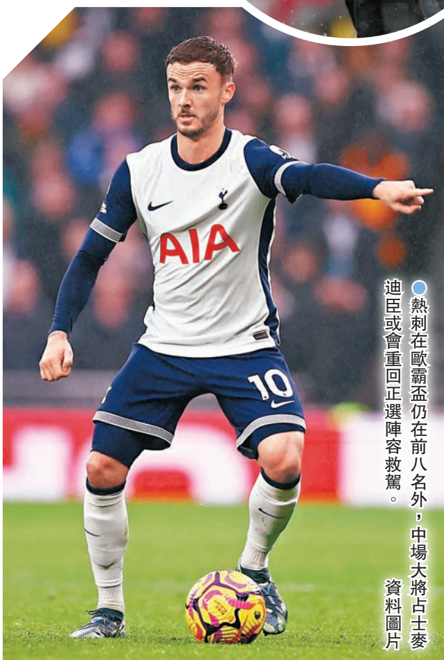
●熱刺在歐霸盃仍在前八名外，中場大將古士麥迪臣或會重回正選陣容救駕。 資料圖片