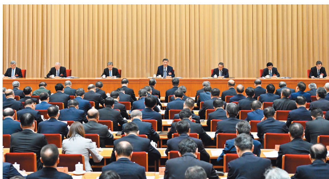
12月11日至12日，中央經濟工作會議在北京舉行。中共中央總書記、國家主席、中央軍委主席習近平出席會議並發表重要講話。李強、趙樂際、王滬寧、蔡奇、丁薛祥、李希出席會議。 新華社

會議強調，要加強黨對經濟工作的領導，堅持幹字當頭，增強信心、迎難而上、奮發有為，確保黨中央各項決策部署落到實處。要強化正向激勵，激發幹事創業的內生動力。切實為基層鬆綁減負，讓想幹事、會幹事的幹部能幹事、幹成事。堅定不移懲治腐敗，保持公平公正的市場環境、風清氣正的營商環境。堅持求真務實，堅決反對熱衷於對上表現、不對下負責、不考慮實效的形式主義、官僚主義。統籌發展和安全，抓好安全生產，有效防範和及時應對社會安全事件，增強協同聯動，反對本位主義，形成抓落實的合力。加強預期管理，協同推進政策實施和預期引導，提升政策引導力、影響力。同時，要準確把握世情國情黨情社情，加強戰略謀劃，制定好中央「十五五」規劃建議。