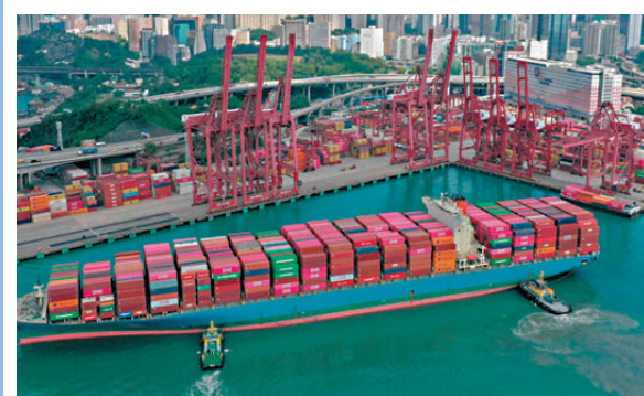
●貿發局指出，歐盟將逐步推行更多為特定行業而設的規定，對產品可持續性和低碳要求越來越嚴格。圖為葵青貨櫃碼頭。 資料圖片

新監管框架涵蓋一系列規例，包括《可持續產品生態設計法規》（Ecodesign for Sustainable Products Regulation）、《商品維修指令》（Directive on Repair of Goods）和《綠色聲明指令》（Green Claims Directive）等，就可持續產品的性能和向消費者提供的資訊訂明要求。這些法規訂立的生態設計要求覆蓋廣泛，幾乎所有行業的產品都必須遵守，才能進入歐盟市場。此外，《可持續產品生態設計法規》的內容還包括設立數碼產品護照，同時建立框架，禁止銷毀未售出的紡織品、鞋類等消費品。