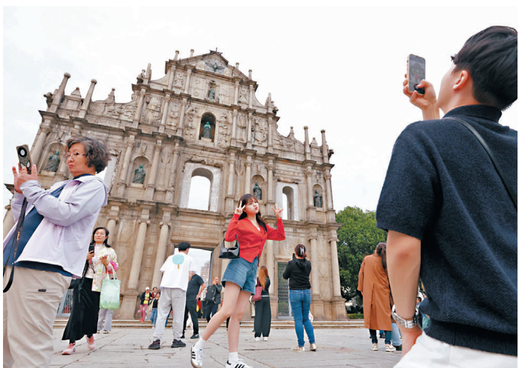
●澳門回歸後內地遊客明顯增多，且消費力愈來愈強。