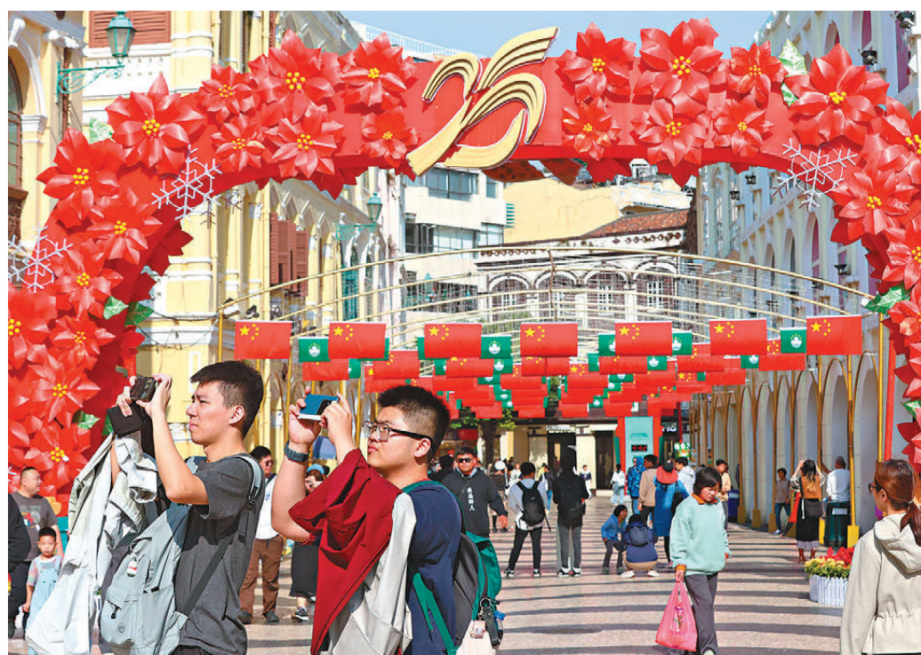
●內地遊客說，看到澳門四處紅旗飄揚，感到十分親切。