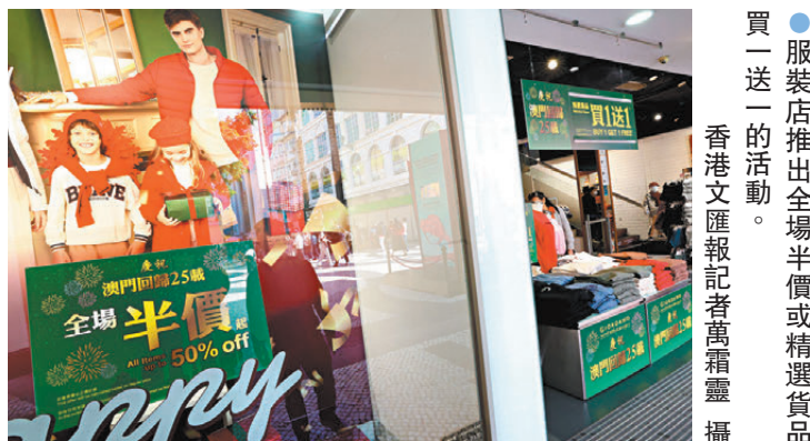
●服裝店推出全場半價或精選貨品買一送一活動。

澳門不少商舖均打出了具有吸引力的折扣，共慶紀念日。有連鎖服裝店為慶祝澳門回歸25周年，推出精選貨品買一送一的活動。店員王小姐表示，雖然每逢節假日，該店都會推出一