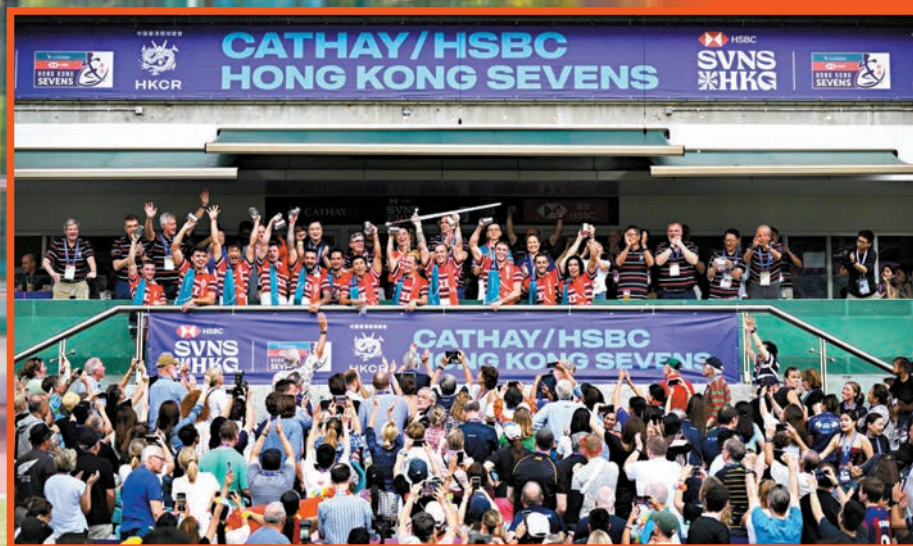
●中國香港七欖男子隊去屆在主场奪得銀劍賽冠軍。