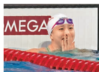
●唐錢婷對在準決賽游出的時間有點喜出望外。新華社

香港文匯報訊 綜合新華社報道,中國蛙泳名將唐錢婷11日在布達佩斯短池游泳世錦賽女子100米蛙泳準決賽中游出1分02秒37的成績,打破由她自己保持的該項目短池亞洲紀錄,距離短池世界紀錄只差0.01秒。