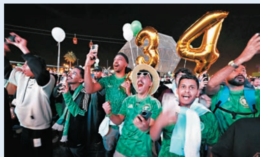
●街頭上的沙特民衆歡呼喝彩。