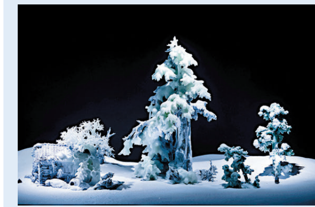
●岫岩玉雕《家在東北》系列。