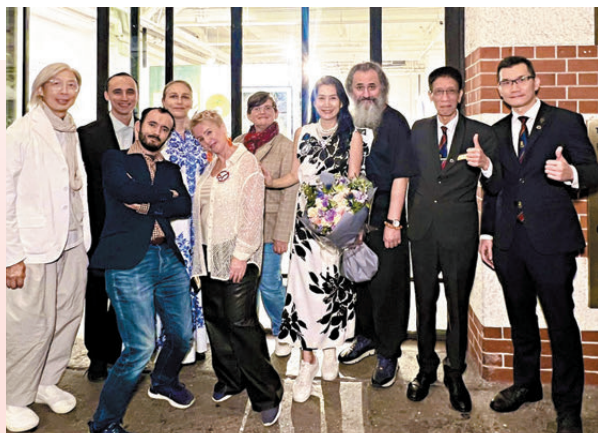
●各國及地區藝術家共同呼籲人們守護和平。