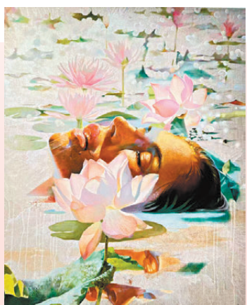
●《在我心裏》表達了對平靜內心的深刻嚮往。