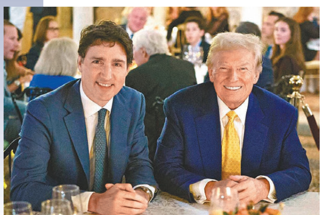
● 加拿大眾多省長力促杜魯多(左)對特朗普採取強硬態度。

杜魯多較早前曾表示加拿大將對特朗普不公平徵收關稅作出回應，並提及特朗普在首屆總統任期對加拿大的鋼鐵和鋁徵收關稅時，加拿大也徵收報復性關稅反制美國，直至後來特朗普作出讓步才取消關稅。加拿大當時針對美國 250 多種商品徵收關稅，包括啤酒、威士忌和橙汁。