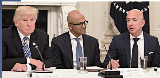
● 貝索斯(右)計劃下周前往佛羅里達州海湖莊園拜訪特朗普(左)。

兩人的恩怨可追溯至 2015 年，當時特朗普在社媒發文稱，貝索斯將收購回來的《華盛頓郵報》用作「大型避稅場所」。貝索斯回應稱，他的太空公司「藍色起源」會為特朗普保留一個座位，暗示要將特朗普送到月球。2019 年，亞馬遜稱該公司失去美國國防部一份價值 100 億美元 (約 778 億港元) 的雲端運算合約，是因特朗普施加不當壓力。