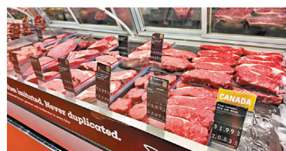
● 加拿大輸美的牛類產品，較其他市場總值高出 5 倍。

油菜籽是加拿大其中一項重要出口，而美國是油菜籽的最大市場，加拿大在 2023 年向美國出口 86 億加元 (約 473 億港元) 油菜籽，極可能成為特朗普開刀目標。加拿大油菜籽理事會主席戴維森表示，美國新政府意圖大幅調高關稅，農業部門必須審慎應對。農業信貸銀行首席經濟顧問傑爾偉指出，加拿大食品供應鏈與美國緊密結合，美國若果大增關稅勢必提高加拿大生產商的營運成本並擠壓其所得利潤，導致生產商更難制定新的業務計劃和投資。他們認同加拿大必須尋找其他出口市場，即