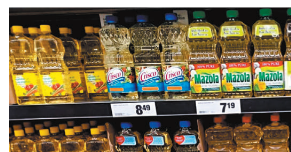
● 油菜籽製成的食用油是加拿大主要出口產品。

農業聯合會主席柯里指出，特朗普偏重保護主義將推高通脹率，美國消費者首當其衝承受價格飆升壓力，但最終也會波及加拿大消費者。自特朗普當選以來，加元兌美元匯率持續下跌，加拿大日後同時承受關稅上升和匯價偏弱的壓力。經濟分析師指出，特朗普再度入主白宮及其「美國優先」承諾，將在未來數年衝擊加拿大農產業，而且生產商還要應付氣候變化、能源價格波動以及圍繞供應鏈的挑戰，生產商面對的困難肯定超過特朗普首屆總統任期。