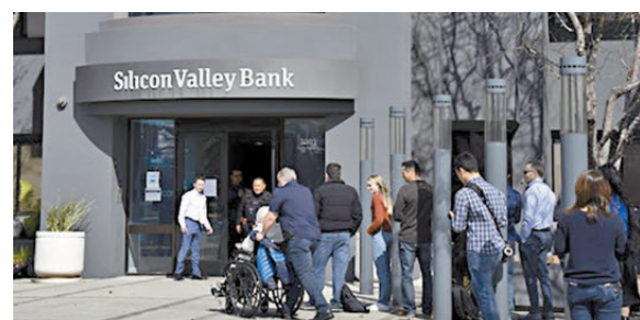
● 美國去年接連有地區性中小型銀行倒閉，引發存款戶信心危機。

美國是上世紀以來多次全球金融危機的罪魁禍首，建立全面的金融監管制度是美國對自己過往所犯過錯的「贖罪」，特朗普及他身邊的跳樑小丑現今企圖做的事，就是讓美國以至全球暴露在下次金融危機的風險之中，是極度不負責任的行為。