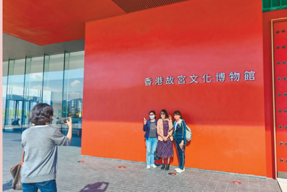
●「一簽多行」實施後，深圳市民赴香港故宮文化博物館觀展打卡。