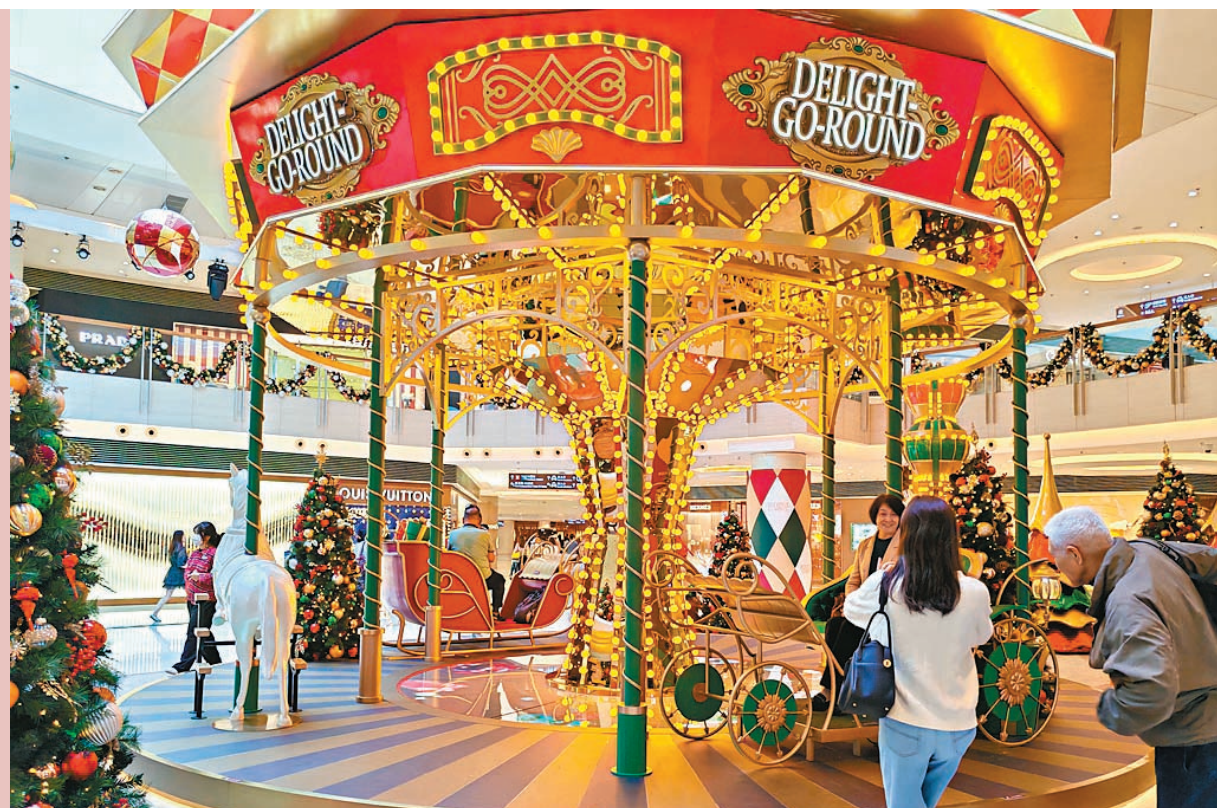
●香港濃厚的聖誕氛圍吸引深圳市民。