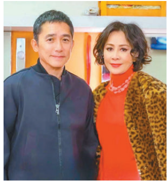
●偉仔前晚現身支持嘉玲。