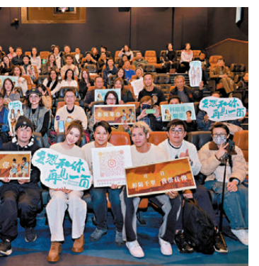
●何超蓮在影院中與粉絲們合影留念。