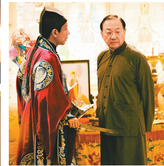
▲影片以香港本土非遺「破地獄」儀式為引子。