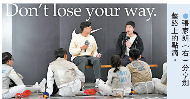
●張家朗(右)分享劍擊路上的點滴。

世界排名第一的張家朗在月初舉行的花劍世界盃高崎站摘下銅牌，他返港後稍作調整便會在月尾出發往巴黎訓練備戰。他昨日出席NIKE舉行的分享會，以自身傳奇經歷及其個人座右銘「DON'T LOSE YOUR WAY」(提醒自己不要輕言棄，勿忘初心)，啟發並激勵年輕劍手們繼續不懈前行。他除分享面對逆境時如何克服困難，亦重談奧運經典「決三劍」贏得金牌的心理調整。他隨後換上劍衣上陣與其中一名小劍手「決三劍」(打3分)，最終張家朗以3:2取勝，小劍手仍獲得印有「DON'T LOSE YOUR WAY」的紀念獎牌。