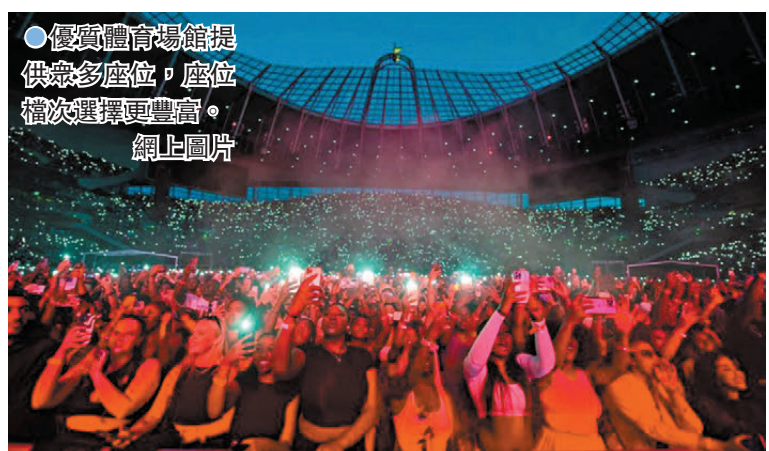
●優質體育場館提供眾多座位，座位檔次選擇更豐富。

香港文匯報訊 能夠容納數萬觀眾的大型體育場館，吸引愈來愈多歌手舉行演唱會。英國廣播公司(BBC)統計顯示，在2022年，英國最大的體育場溫布萊體育場舉辦的娛樂演出數目，與其舉行的足球比賽數目相若。想要承辦優質的演唱會，承辦方要利用好體育場館的寬敞空間，還要在座位、燈光、音效、舞台布局和配套設施等細節下工夫。