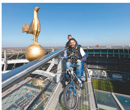
●熱刺球場設有天空步道，成為遊客熱點。

負責設計該體育場館的Populous公司業務總經理克利斯多弗表示，新場館的成功經營，是硬件設施和軟實力結合的成果，「它不僅是一座足球場。球迷們會來看比賽，但若你的商品質素不佳，這筆消費會流向附近的酒吧或食肆。」