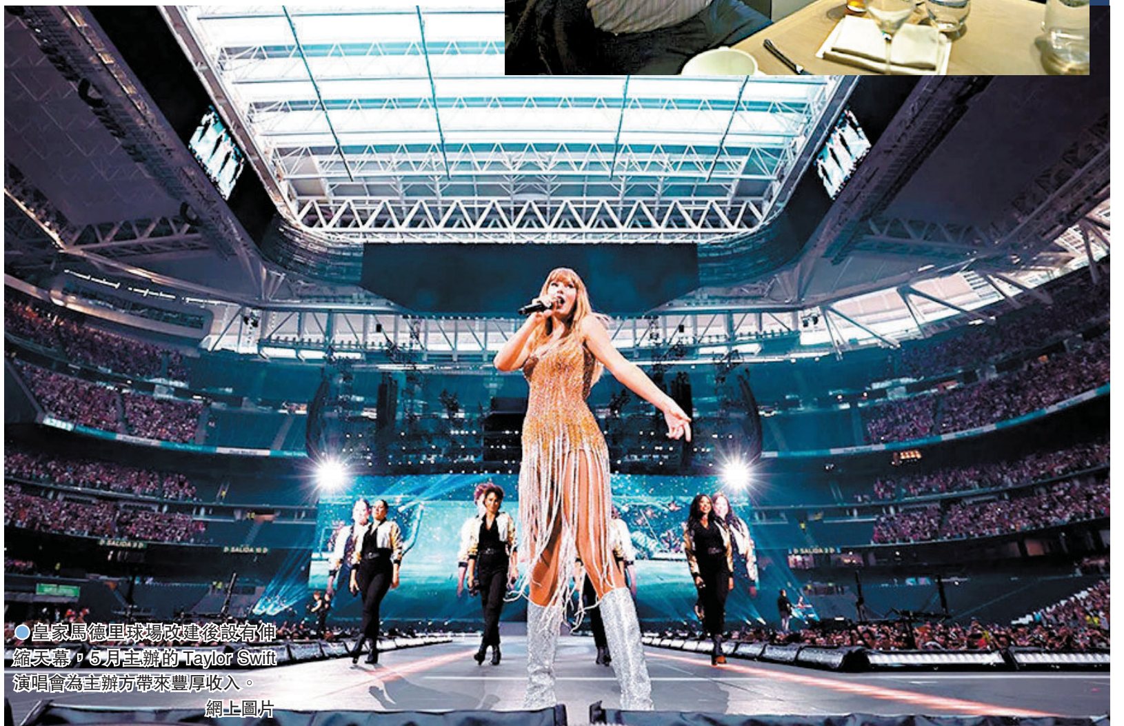
●皇家馬德里球場改建後設有伸縮天幕，6月主辦的Taylor Swift演唱會為主辦方帶來豐厚收入。