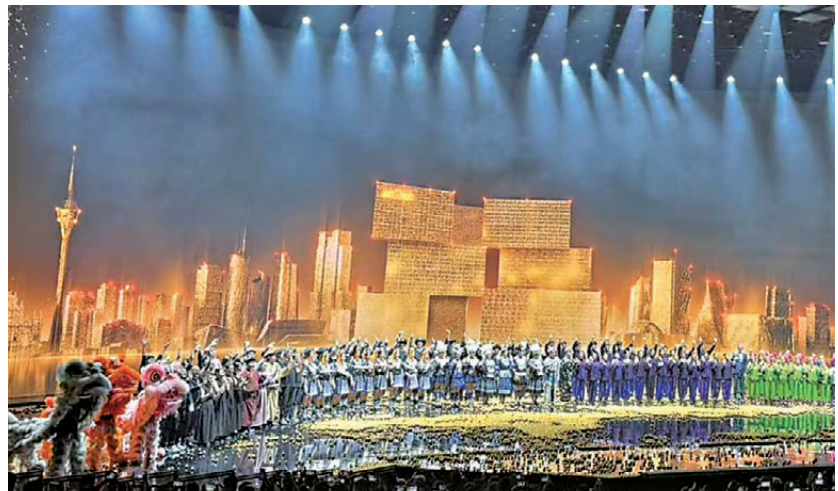
《澳門2049》昨日在澳門開演。

香港文匯報訊 據新華社報道，澳門回歸祖國25周年獻禮演出《澳門2049》昨日在澳門開演，以新穎方式展示中國非遺，為澳門演藝注入新活力。《澳門2049》共有8個節目，分別為神鼓、影子、呼麥、飄渺、苗歌、空靈、岔口、面具、秧歌、數控、彝聲、海洋、美獅、光芒、唱書、源起。短短80分鐘裏，集中呈現了西北花兒、蒙古族呼麥、苗族古歌、京劇、北方秧歌等8種非遺，通過現代科技賦予非遺全新的呈現形式。