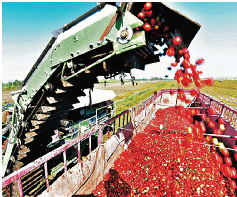
●新疆巴音郭楞蒙古自治州庫爾勒市哈拉玉宮鎮番茄種植基地內的機械化採收場景。