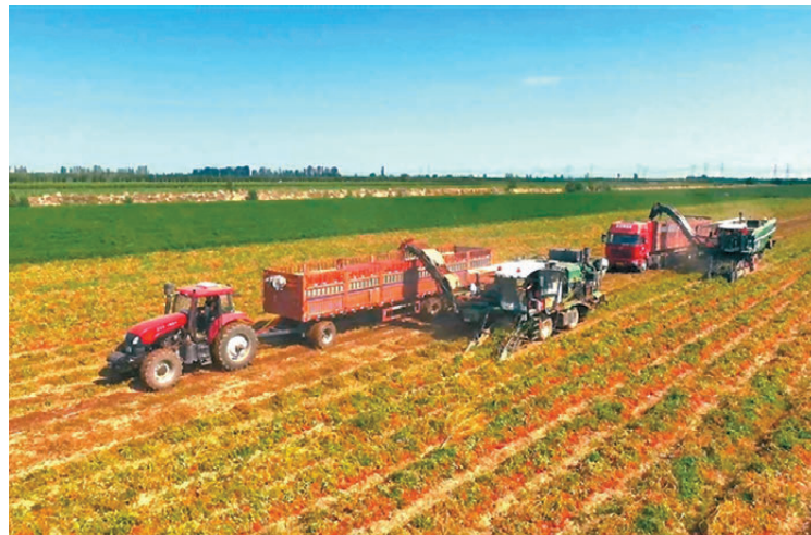
●新疆昌吉回族自治州瑪納斯縣瑪納斯鎮二工村的加工番茄地裏，兩輛加工番茄採收機正在採收番茄。