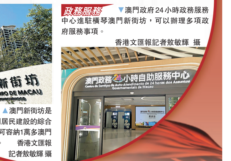
政務服務 ●澳門政府24小時政務服務中心進駐橫琴澳門新街坊，可以辦理多項政府服務事項。