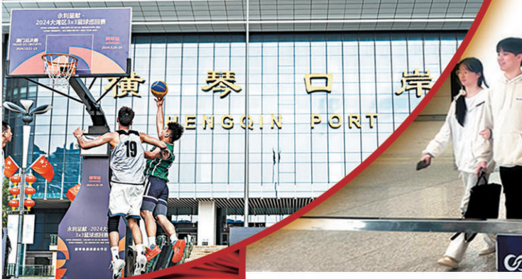
●今年9月，橫琴口岸迎來籃球賽事，豐富了合作區居民的體育休閒生活。