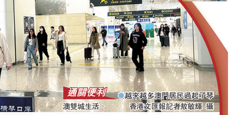
通關便利 ●越來越多澳門居民過起了琴澳雙城生活。