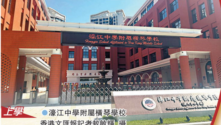
上學 ●濠江中學附屬橫琴學校。