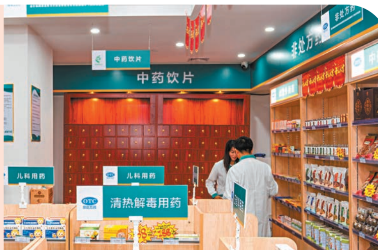
◀「全澳藥店」在橫琴開業，澳門藥學技術人員在該藥店提供藥學服務。