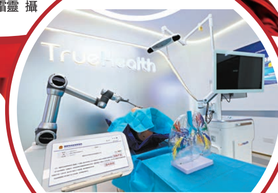
●穿刺手術導航定位系統。