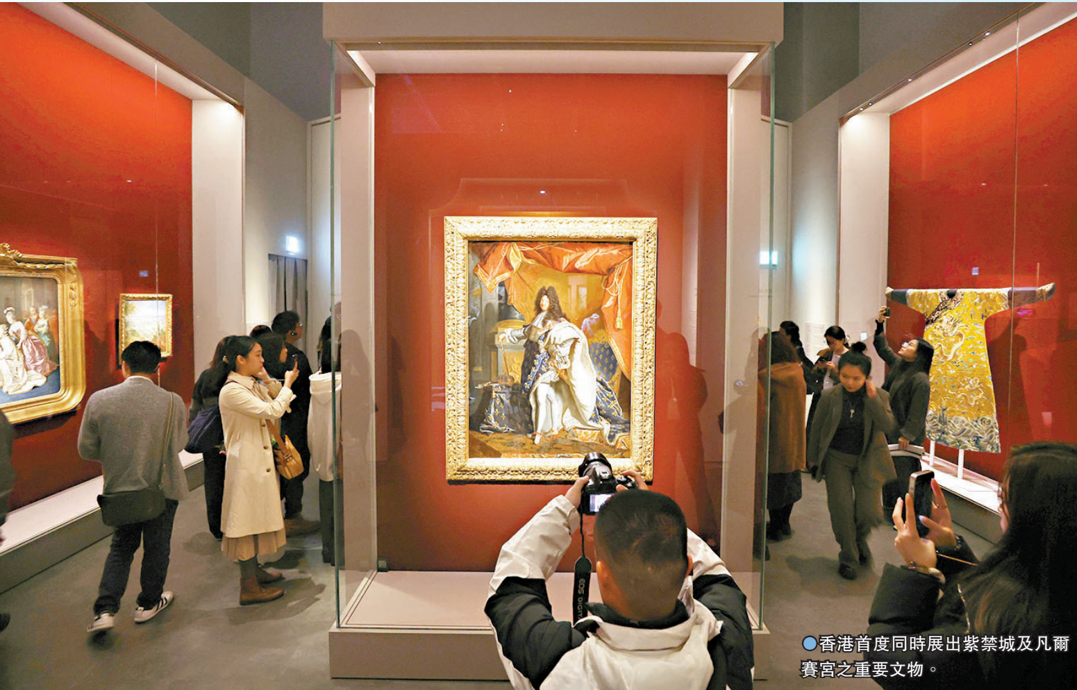
●香港首度同時展出紫禁城及凡爾賽宮之重要文物。