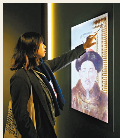
●觀眾通過多媒體屏幕探索乾隆帝瓷板像的細節。

「工藝互鑒與創新」中的故宮博物院館藏的國家一級文物——菊花紋壺，則反映了一段「中國訂製、法國製造」的工藝交流故事。郭福祥介紹，此壺過去一直被以為是廣東官員送給清廷的貢品。近年來，故宮博物院專家在其底部發現一個細小的紅款，由十八世紀法國著名琺瑯工藝師約瑟夫·科托所署。原來，在乾隆四十年(1775年)，乾隆帝下令製作新品且「務要洋琺瑯」，廣東海關官員便把一批製作琺瑯器的訂單及樣品發至法國。科托在金胎上繪製出中國風格的花卉紋樣。此壺製成後，便由乾隆帝珍藏。