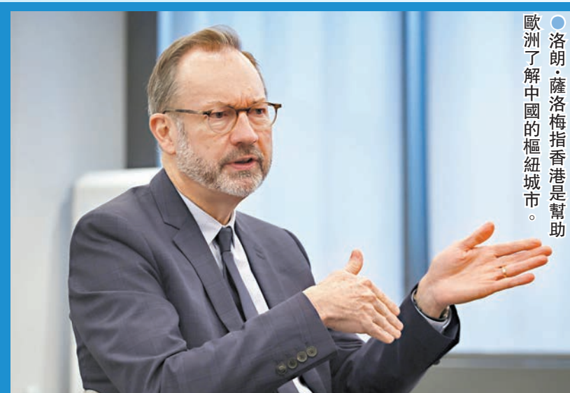
●洛朗·薩洛梅指香港是幫助歐洲了解中國的樞紐城市。