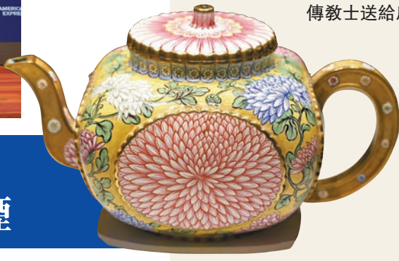
●菊花紋壺上中國風格的花卉紋樣由法國工藝師所繪。