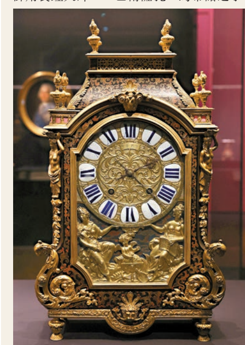
●黑漆彩繪鐘曾通過法國傳教士送給康熙皇帝。

「科學與外交」單元中的一件黑漆彩繪鐘，出自路易十四宮廷御用製鐘大師——巴爾薩扎·馬蒂諾之手。該鐘通過法國傳教士送給康熙。到了乾隆時期，由於外層的布爾鐘嵌修復困難，清宮對鐘進行了局部改動，將鐘殼更換為傳統的中式黑漆彩繪板，並為鐘盤添上「乾隆年製」款。故宮博物院研究員郭福祥表示，這隻鐘錶體現了中法兩國對藝術的高度認同。