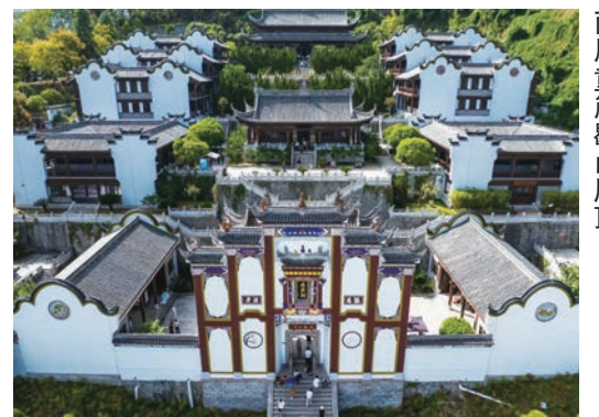
●屈原祠正殿為仿古木構建築，兩層重簷歇山屋頂。

12月終於冬天來臨，隨着雪花紛飛，意味着是時候跟一年一見的雪場打招呼了！宜昌多個滑雪場亦已準備就緒，其中神農架國際滑雪場已開鑼，網紅熱捧的五峰國際滑雪場亦於12月14日緊接上場，至於宜昌純愛聖地百里荒滑雪場2024-2025雪季亦決定於12月20日期間開放。