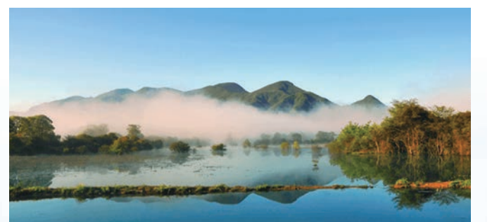
●罈子嶺景區是全國首批5A級景區，是三峽壩區最早開發的景區。

關於宜昌的關鍵詞，一定是全球最大的長江三峽水利樞紐工程。長江三峽由瞿塘峽、巫峽、西陵峽組成，西起重慶市奉節縣的白帝城，東至湖北省宜昌市的南津關，全長193公里，當中宜昌因地利之便，成為不少人遊覽長江三峽的起點，同時亦可藉機看看耗資4,954.6億人民幣、於2006年修建成功的三峽大壩。當然，遊歷天然的長江三峽自然美景才是正題，遊客大多於早上在宜昌黃柏河碼頭登船，起程後便可觀賞有萬里長江第一壩之稱的葛洲壩；然後進入西陵峽、南津關、三游洞（西陵峽口明珠）、明月灣（三峽第一灣）等著名景點。