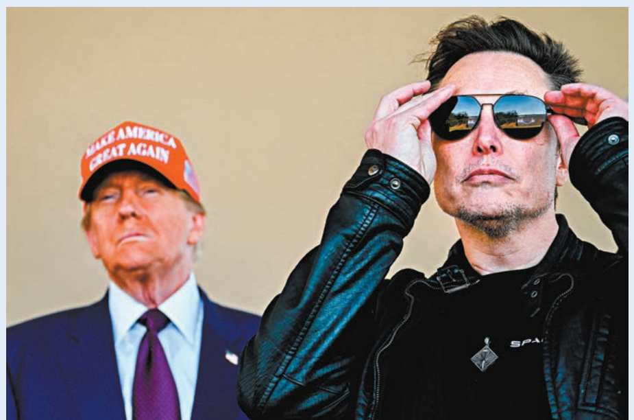
●分析認為馬斯克的商業王國，可從特朗普放寬限制等政策中受益。

民主黨參議員布盧門撒爾稱，馬斯克旗下公司業務廣泛，打着政府效率的幌子負責企業福利，當中的利益衝突不言而喻。他批評「廢除有關自駕汽車的安全規則和監督，只會推高股價、破壞安全，對馬斯克和股東有利，但對司機和馬路上的其他人員無益。」