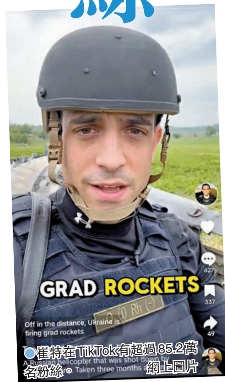
●崔特在TikTok有超過85.2萬名粉絲。