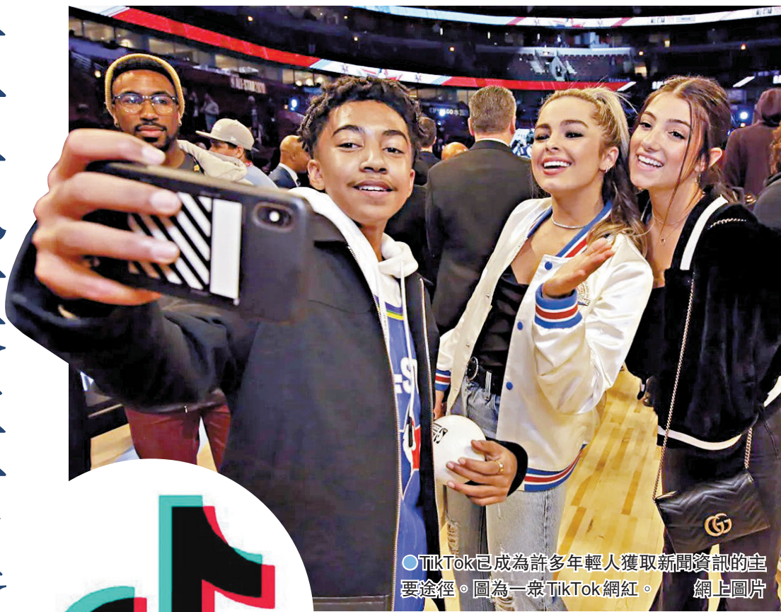
●TikTok已成為許多年輕人獲取新聞資訊的主要途徑。圖為一眾TikTok網紅。

香港文匯報訊 據美國《華爾街日報》報道，社交媒體TikTok已成為許多年輕人獲取新聞資訊的主要途徑，不少美國大型傳統媒體紛紛加入該平台，爭取更多年輕受眾。