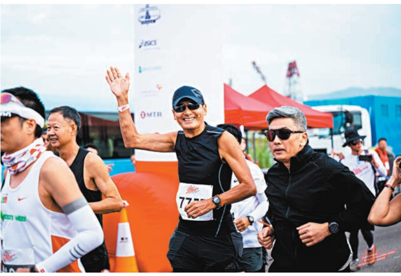
●港珠澳半馬成為了集郵賽事，吸引如周潤發等名人參賽。