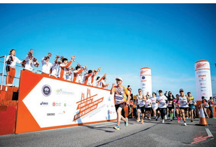
●「港珠澳半馬」有其獨特性及發展空間。

關祺指出「港珠澳半馬」有其獨特性及發展空間，以「放大香港在大湾区位置，打通大湾区的跑步社區」為概念，「希望將來能與其他大湾区體育組織，如珠海、澳門，會有