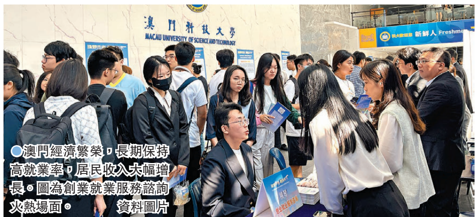
●澳門經濟繁榮，長期保持高就業率，居民收入大幅增長。圖為創業就業服務諮詢熱場面。

就業是最大的民生。回歸前，澳門經濟連續四年負增長，失業率超過6%。在中央大力支持下，回歸初期，特區政府採取固本培元、穩健發展的施政方針，將提振經濟和促進就業作為重要任務，有效保障本地居民就業，尤其是2012年以來，澳門總體失業率多年保持在2%以下。