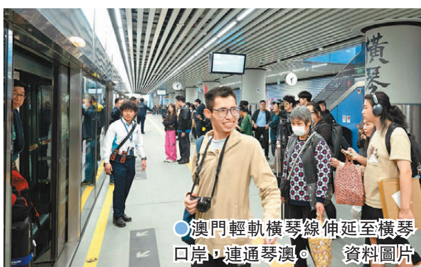
●澳門輕軌橫琴線延伸至橫琴口岸，連通琴澳。資料圖片

橫琴粵澳深度合作區的建設，是一項前所未有的先行試驗。2021年9月5日，中共中央、國務院印發《橫琴粵澳深度合作區建設總體方案》，為橫琴新時期的建設發展提供了方向指引。2023年，《橫琴粵澳深度合作區總體發展規劃》出台，提出要將橫琴粵澳深度合作區打造成促進澳門經濟適度多元發展的新平台，便利澳門居民生活就業的新空間，推動琴澳一體化發展的新示範，以及豐富「一國兩制」實踐的新高地。