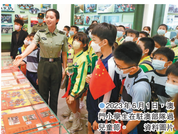
●2023年6月1日，澳門小學生在駐澳部隊過兒童節。資料圖片

教育方面，澳門持續加大教育資源的投入，其公共教育開支由2002年的17億澳門元大增至2023年的127億澳門元。自2007/2008學年起，澳門實施覆蓋幼兒至高中教育階段共15個年級的免費教育制度，是大中華區第一個提供15年免費教育的地區。2023/2024學年約93%的學校加入免費教育系統，政府同時為就讀於非免費教育學校系統私立學校的澳門居民學生發放學費津貼，亦透過教育基金，支援學校興建改建校舍設施，添置教學設備，以及對有助保障和提升教育素質、學生綜合能力及競爭力的各類項目及活動提供資助，並向學生提供福利。