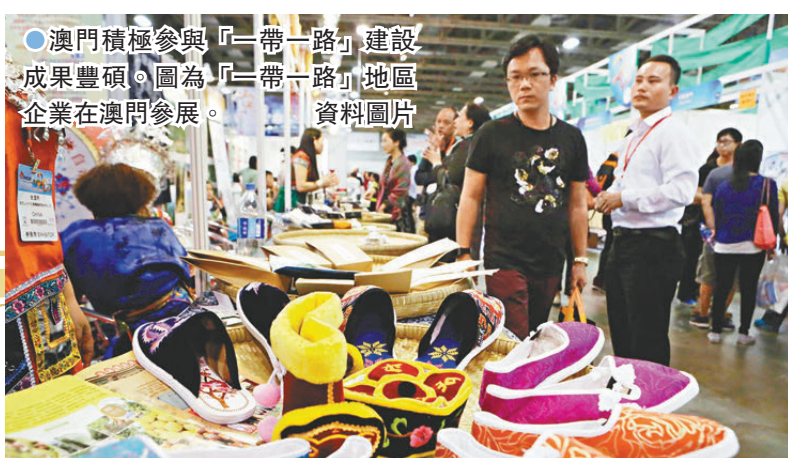
●澳門積極參與「一帶一路」建設，成果豐碩。圖為「一帶一路」地區企業在澳門參展。資料圖片

於2020年設立的青少年愛國愛澳教育基地，目前已成為培養青少年家國情懷的重要場所，同時以基地為據點整合澳門愛國愛澳教育資源，規劃不同的學習路線，推出家國情懷延展教育計劃供不同教育階段學生參與。據統計，自基地開放以來，至今累計接待逾30萬人次的青少年參與活動。