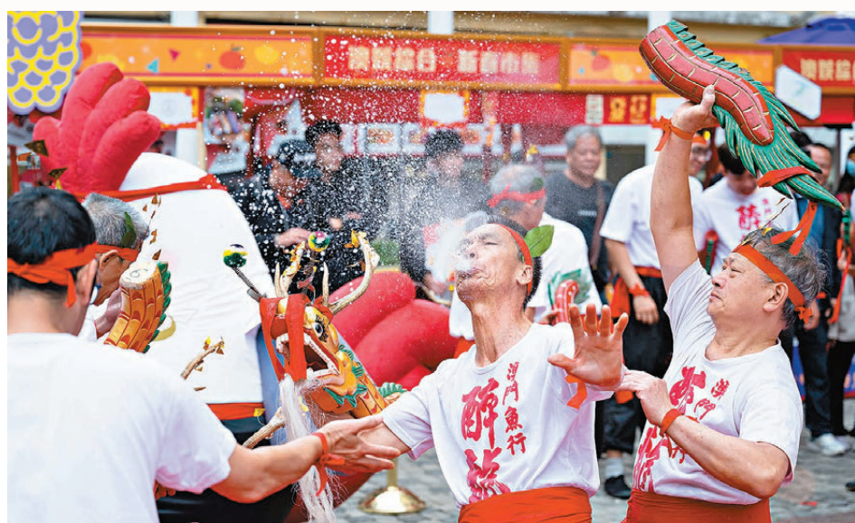
●澳門找準自己定位，大力發展文化體育、大健康等產業，經濟適度多元化發展成果豐碩。圖為舞醉龍隊伍在內港區進行表演。

2019年的12月20日，中共中央總書記、國家主席、中央軍委主席習近平在慶祝澳門回歸祖國20周年大會暨澳門特別行政區第五屆政府就職典禮上的講話中，表示要結合澳門實際，在科學論證基礎上，選準經濟適度多元發展的主攻方向和相關重大項目，從政策、人力、財力等方面多管齊下，聚力攻堅；要積極對接國家戰略，把握共建「一帶一路」和粵港澳大灣區建設的機遇，更好發揮自身所長，增強競爭優勢。特別要做好珠澳合作開發橫琴這篇文章，為澳門長遠發展開闢廣闊空間、注入新動力；要積極回應市民關切，着力解決住房、醫療、養老等方面的突出問題，更加關注對弱勢群體的幫助和扶持。要不斷提高教育水平，