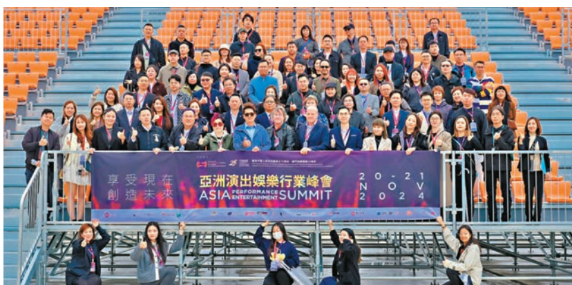
●海內外演藝界人士到「澳門戶外表演區」參觀場地設施。

政府和企業為製作公司提供各種支援，例如場地租金優惠、博彩娛樂場會贊助主辦方的人員住宿、交通優惠等。