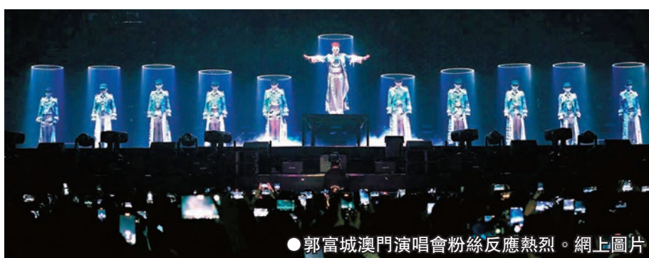
●郭富城澳門演唱會粉絲反應熱烈。網上圖片