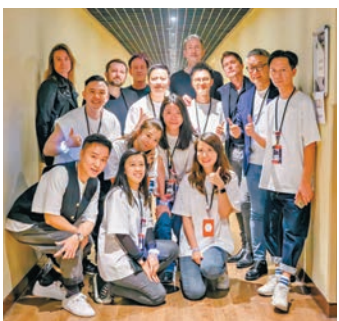
●棋人娛樂團隊和英國樂隊Suede合影留念。