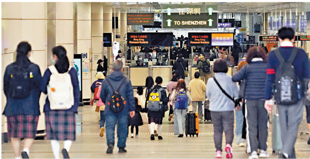
●由於今年除夕凌晨將會舉行長達12分鐘的煙花匯演，李家超表示，羅湖口岸會延長至元旦的凌晨2時、深圳灣口岸將會通宵服務。圖為深圳灣口岸。

的煙花匯演，李家超表示，羅湖口岸會延長至元旦的凌晨2時、深圳灣口岸將會通宵服務；以及落馬洲及皇崗口岸都會保持24小時通宵服務，相關政策局會增加及靈活調派人手，以確保在關口及市上都通暢有序。