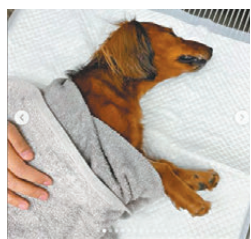
▲Summer 為6歲臘腸狗。