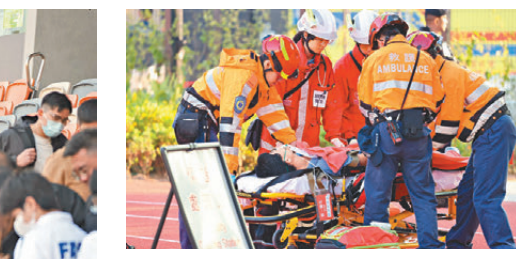
●反恐演習中，重傷者被抬上擔架床即時進行急救。

演習模擬4名持刀槍恐怖分子在看台上亂槍掃射及持刀襲擊觀眾，觀眾受驚湧向出口逃走。警方反恐特勤隊展開圍捕，開槍制服恐怖分子，政府飛行服務隊直升機及警方無人機在空中支援和監察，救護人員為傷者分流急救及送院治理。同時，警方拆彈專家及拆彈機械人員負責清除觀眾席上炸彈，消防處派出危廢物專家及機械犬，模