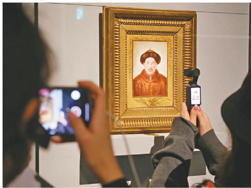
●「當紫禁城遇上凡爾賽宮」十七、十八世紀中法文化交流「特展現場」。

「比如法國皇帝的一封信，在北京故宮博物院展覽時就是放在最前面展示出來，但在香港故宮館，它變成一個互動體驗。文物動起來，並且延伸出來被設計成明信片，觀眾可以寄給朋友。這個就很有意思。」適逢「當紫禁城遇上凡爾賽宮」十七、十八世紀中法文化交流「盛大開展，北京故宮博物院院長王旭東也來到香港。忙中偷閒，終於找到時間細細在展館中走一圈的他，以「美輪美奐」形容展覽現場，更坦言許多角落都讓他眼前一亮。「故宮館的每個展覽都有其特色，體現每一位策展人及其策展團隊的學術積澱及理念，也體現了北京與香港兩方團隊在不同的教育背景與視角下，怎樣融合，怎樣相向而行。」