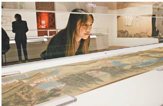
●香港故宮明代人物畫展覽現場。

他也希望觀眾不要將注意力只集中在如《清明上河圖》或《韓熙載夜宴圖》等明星珍品身上，北京故宮博物院實際上有大量的一級文物及珍品，都值得大家細細品味，未來更可以從各個角度來進行策展。他透露兩地團隊已經規劃好了2025至2026年的展覽，「比如明年會有宮廷飲食展，透過皇家飲食文化可以看到整個國家不同地域飲食文化在皇宮中的匯聚。」甚至未來也可以策展生動展現皇子的生活，看看皇家如何教養小孩，「最重要的是要依靠故宮強大的研究團隊的學術成果，並藉助策展團隊將其轉