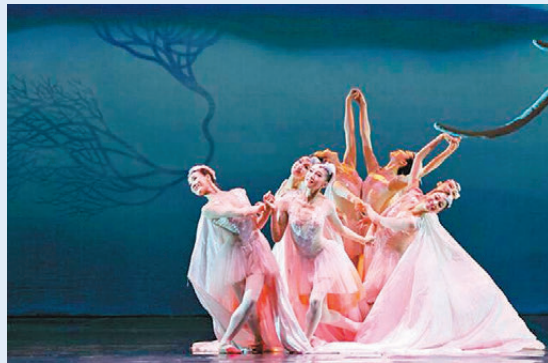
●舞劇《朱鷲》劇照。

其次，舞劇《朱鷲》體現出深邃的內涵。舞劇的呈現遠不止於美，更有對人與自然關係的反思。舞劇《朱鷲》2014年在日本巡演時一票難求。許多日本觀眾觀看演出後，流下了感動的淚水，久久不肯離場。時任日本首相安倍晉三攜夫人也觀看演出並給予了高度評價；還有日本學生觀看演出後表示要轉學生物學專業。舞劇《朱鷲》在日本巡演，無疑是一次成功的民間外交。此後，舞劇《朱鷲》多次「飛」出國門，在美國紐約林肯藝術中心演出時，座無虛席，周日場更