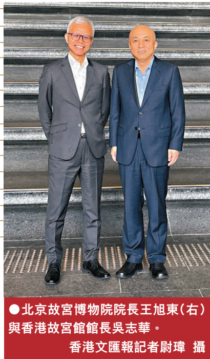
●北京故宮博物院院長王旭東(右)與香港故宮館館長吳志華。