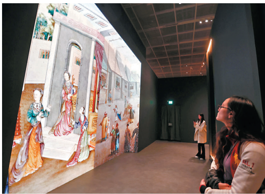
●「當紫禁城遇上凡爾賽宮」十七、十八世紀中法文化交流「特展現場」。