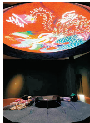
●香港故宮的互動體驗新穎有趣，曾是深圳人赴港親子遊的熱門目的地榜首。

今年11月，澳門故宮文化遺產保護傳承中心正式成立，王旭東說，北京故宮博物院、香港故宮館、台北故宮，與現在澳門的保護傳承中心，以故宮相連，但各有側重。「但它們共同的使命都是保護傳承，未來四地更要相互支持、共同成長。」明年將會是北京故宮博物院成立100周年，「在這個非常重要的歷史時刻，希望大家一起能夠達成更廣泛的共識。」王旭東說道。