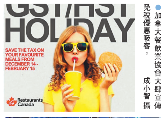
●加拿大餐飲業協會大肆宣傳免稅優惠吸客。

免除稅收措施持續直至2025年2月15日，經濟學者提出警告，聯邦政府對某些商品臨時免除貨勞稅可能導致通脹重現後果，因為免除貨勞稅可能在供應不增加的情況下刺激需求。