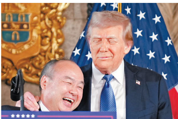
●特朗普(右)稱讚孫正義是一位「傑出的人」。

報道稱，這名日本富豪加入商界巨頭們的行列，他們正爭先恐後向特朗普靠攏，透過捐款及社交活動等方式與特朗普建立聯繫。此前美國科企OpenAI、亞馬遜和Meta先後宣布將向特朗普就職基金捐款100萬美元(約776萬港元)。