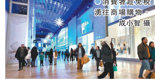
●消費者趁免稅湧往商場購物。