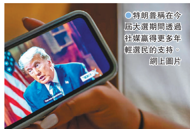
●特朗普稱在今屆大選期間透過社媒贏得更多年輕選民的支持。

領先特朗普的46%。特朗普在記者會上還將自己勝出大選，歸功於與部分非傳統傳媒的合作，包括他接受全美最知名網絡播客主持人羅根(Joe Rogan)的訪談。特朗普宣稱自己的幼子、18歲的巴倫幫助他找到「正確的傳媒宣傳渠道」，以贏得年輕選民支持。