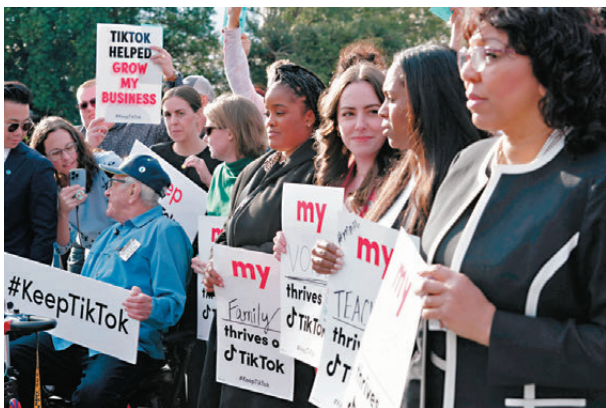
●美國民眾抗議封殺TikTok。

美聯社指出，特朗普團隊如果要阻止封殺TikTok，可能會要求司法部放棄執行法例，或敦促國會廢除封殺令。不過國會共和黨人普遍贊成剝離TikTok在美業務，至於總統的行政命令則不能凌駕於法律之上，變相限制特朗普的行動空間。