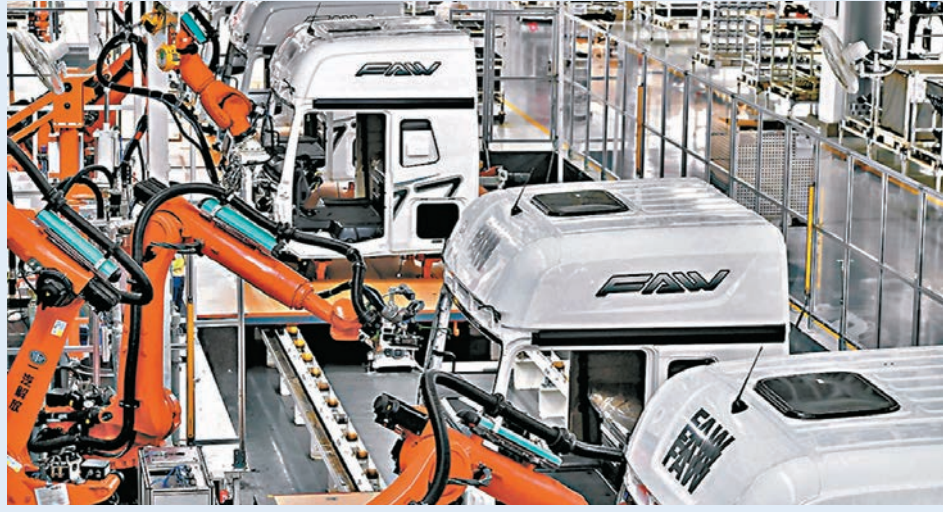
● 國務院國資委昨日發文，要求加強央企控股上市公司市值管理工作。圖為一汽解放 J7 智能工廠內，智能機器人進行車輛玻璃裝配及塗膠工作。

香港文匯報訊 上周召開的中央經濟工作會議指出，要深化資本市場投融資綜合改革，打通中長期資金入市卡點堵點，增強資本市場制度的包容性、適應性。國務院國資委昨日發文，要求加強央企控股上市公司市值管理工作，引導央企控股上市公司增加現金分紅頻次和比例，支持圍繞提高主業競爭優勢、增強科技創新能力、促進產業升級實施併購重組。