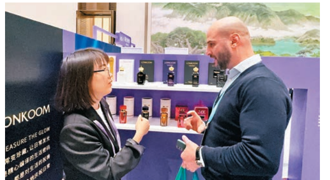
●是次展會吸引了海內外院士專家、品牌方、供應鏈企業代表等2,000多名嘉賓參會。圖為國際買家了解廣州產品。

第二屆廣州國際美妝周活動將持續至21日，期間將舉辦多項活動，當中還包括邀請重要嘉賓及國際買家團深入廣州市化妝品行業的領軍企業，親身體驗其研發中心的前沿科技與工廠的生產流程。