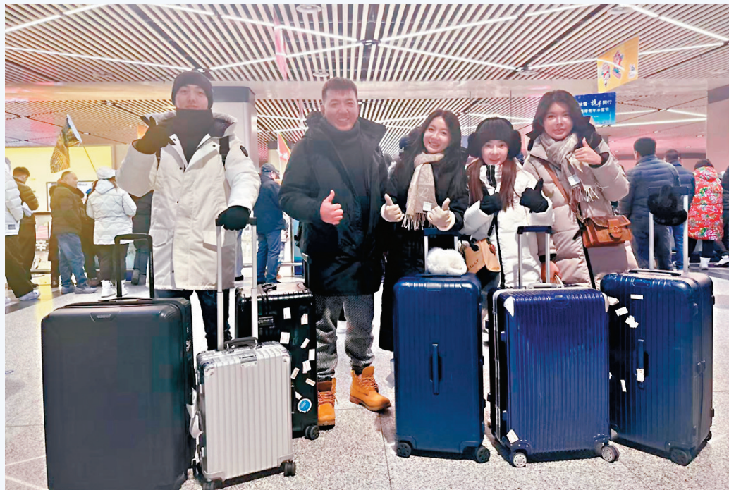
●台灣青年抵達哈爾濱。

據悉，海峽兩岸青年冰雪節於12月18日至24日在哈爾濱市舉辦。此次冰雪節以「燃情冰雪·攜手同行」為主題，旨在通過冰雪這一獨特的載體，促進兩岸青年的交流與互動。活動期間，將舉辦兩岸青年交流座談會、第九屆亞洲冬季運動會場館巡禮、冰雪體驗和參訪交流等多項精彩紛呈的活動。