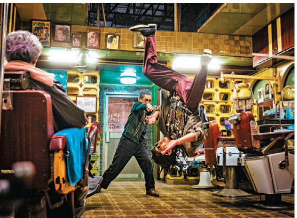
觀眾認為《九龍城寨之圍城》體現了香港電影在商業性和藝術性上的雙重追求。

值得一提的是，香港導演陳可辛在本屆電影節上榮獲「傑出電影成就獎」。王曉燕表示，香港很多電影導演在追求商業成功的同時也能夠很好地兼顧藝術價值，陳可辛是其中的傑出代表，他的影片題材非常廣泛，涵蓋武俠、愛情、傳記、體育等多種題材，如《甜蜜蜜》是經典愛情片，《投名狀》是古裝武