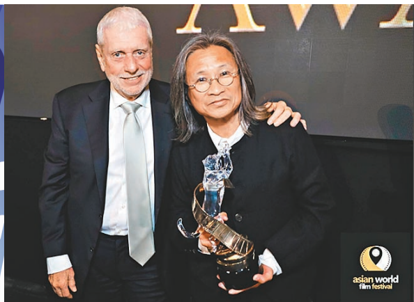
在本屆亞洲國際電影節上，安德魯·摩根為香港著名導演陳可辛(右)頒發「傑出電影成就獎」。

在第十屆亞洲國際電影節上，香港電影和電影人大放異彩，《九龍城寨之圍城》《甜蜜蜜》《命案》和《花樣年華》這四部香港電影舉行了專題展映，著名導演陳可辛還榮獲「傑出電影成就獎」。該電影節競賽單元評委會主席王曉燕對香港文匯報表示，香港與內地電影除了傳統的合拍模式，還可在投資、製作、發行等環節進行更加深入的合作，實現資源共享和優勢互補，特別是借助香港電影在國際電影市場的渠道和經驗，攜手將兩地合拍項目推向更廣闊的國際市場，共同提升華語電影的國際競爭力。