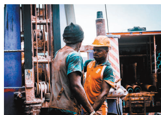
●專家認為單靠外勞彌補勞動人口老化和刺激經濟，只能在短期內有效。網上圖片

專家指出，外勞和新移民增加，亦意味英國社會需要提供更多基建去支持，長遠而言，外勞對減輕就業人口老化的幫助，亦會因為外勞本身年紀增長而減退，最終政府還是要為在英國定居的外勞及新移民照顧退休生活，沒完沒了。