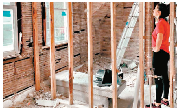
●由計劃裝修或改建到正式動工，戶主往往要等好幾個月時間。