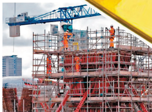
●英國政府提出在2029年之前，要在英格蘭地區興建150萬套房屋。