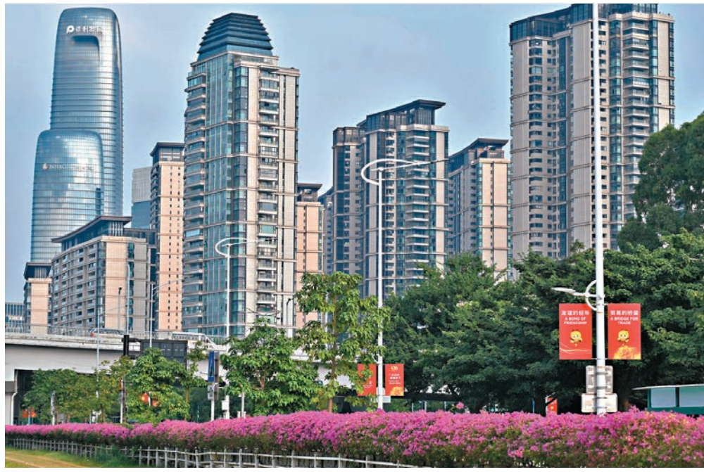
● 有房地產分析師認為，取消公攤面積有利降低購房成本，有助堅定購房者信心，明年「取消公攤」將成為購房領域的熱點內容。圖為廣州海珠區的建築群。資料圖片

《通知》要求地產開發商在簽訂商品房網簽合同時，應與購房人約定按套內建築面積計算商品房價款，開發商、房地產中介機構應當對每套商品房按套內建築面積進行明碼標價，並在銷售場所醒目位置放置標價牌、價目表或者價格手冊。