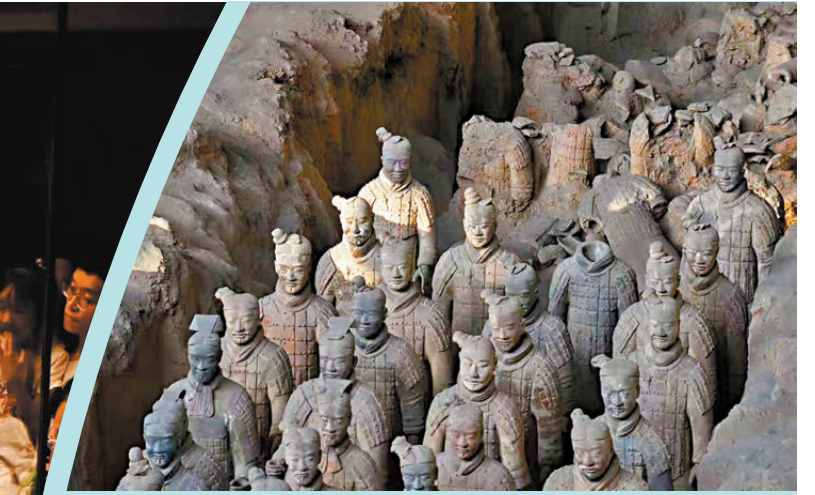
秦兵馬俑被譽為「世界第八大奇跡」。

據介紹，作為秦兵馬俑科技考古的典範，搭建在考古發掘現場的保護實驗室，被稱為出土文物「醫院」。實驗室不僅實現了文物從發掘到存儲的全流程自動化對接，極大的保障文物從出土環境向文物庫房保存環境的平穩過渡，讓文物第一時間得到最妥善的照顧，避免了文物在修復之前、遠距離搬運中可能面臨的風險。同時，實驗室四周均為透明的玻璃門窗，來二號坑參觀的遊客，都可以透過玻璃窗，看到這裏正在進行的文物保護與修復工作，開創了秦兵馬俑考古發掘及文物保護的新方法、新模式與新範本。