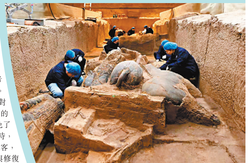
秦兵馬俑二號坑發掘現場。