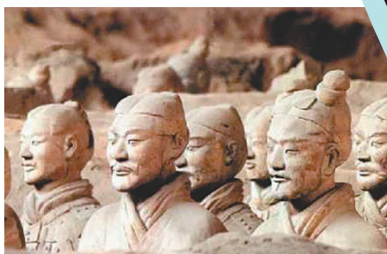
兵馬俑從發掘現場可見兵馬俑均為單眼皮。

在此次發掘中，秦俑二號坑考古項目負責人向媒體介紹，目前在一、二、三號坑中展示和發掘的兵馬俑均為單眼皮，此次剛剛確定身份的三號坑新發現的俑同樣為單眼皮。對於出土兵馬俑均為單眼皮學界暫無定論，這位負責人表示，目前存在的猜測為兩種。其一，單眼皮可能和人種、民族有一定關係，那時候的人大部分都是單眼皮；其二，雙眼皮看起來稍顯和善，容易接觸交流，而單眼皮表情冷峻、嚴肅，可能與軍隊的角色需要有關。