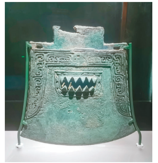
雙面齒雲雷紋青銅大鉞。

距離新干大墓東南約2.5千米的牛頭城，依山而建。內外城相套，內城宮殿寬廣，外城煙火繁忙，儼然一處方國都邑。牛頭城與新干大墓，前者為王的都城，後者為王的陵墓。墓中出土的大量以虎形為裝飾的隨葬品，更是攜