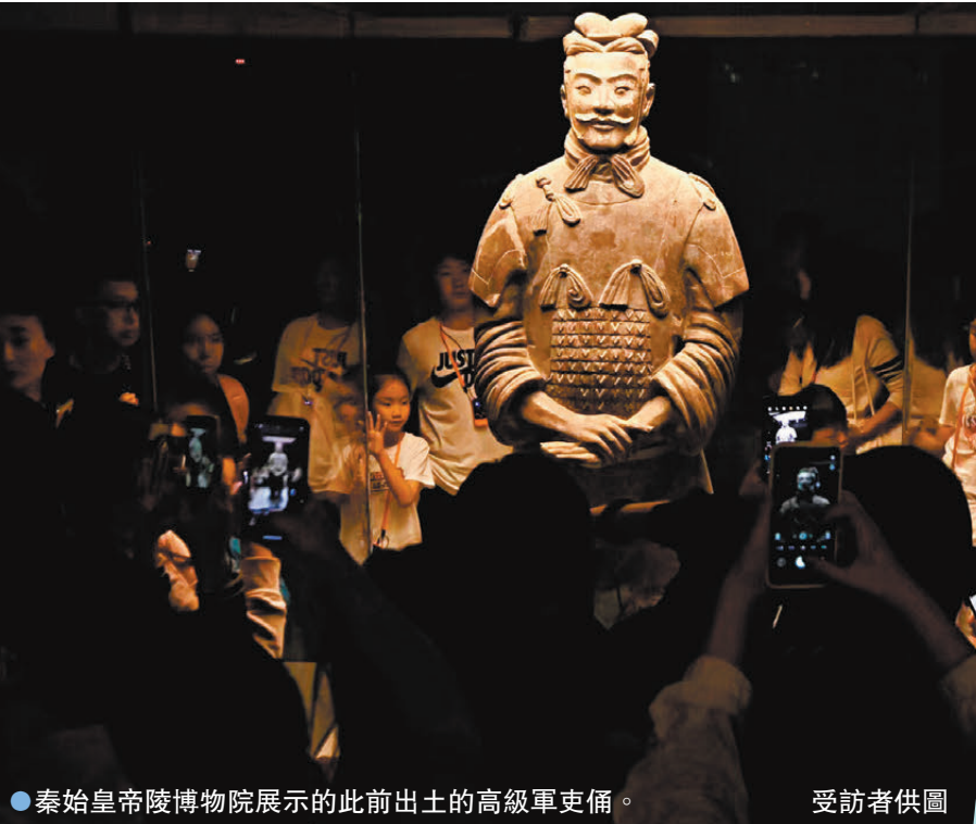
秦始皇帝陵博物院展示的此前出土的高級軍吏俑。

據悉，高級軍吏俑又稱將軍俑，是兵馬俑坑中級別最高的俑，目前僅發現了10尊高級軍吏俑。根據此前從兵馬俑一號坑