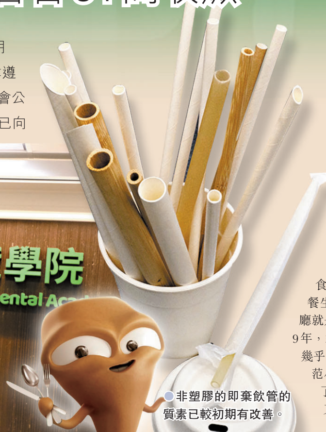
●非塑膠的即棄飲管的質素已較初期有改善。

黃智華表示，過去兩個月的走塑成效相當理想，「10月22日適應期完結後，我們走訪餐飲業界，發現整體非常配合遵守法規，不少市民也因而建立了自備餐具的習慣。」現時八成連鎖食肆顧客選擇不要外賣餐具，三成食肆甚至不再提供，已初步起到移風易俗的效果。