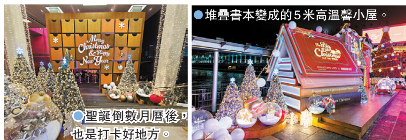
● 堆疊書本變成的5米高溫馨小屋。