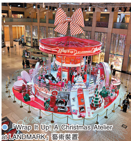
● 「Wrap It Up! A Christmas Atelier at LANDMARK」藝術裝置