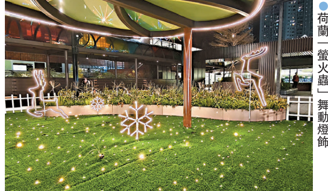
● 荷蘭「螢火蟲」舞動燈飾