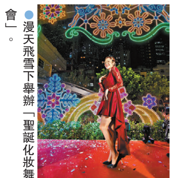
● 漫天飛雪下舉辦「聖誕化妝舞會」。