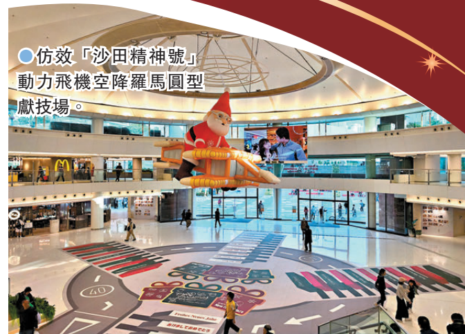
● 仿效「沙田精神號」動力飛機空降羅馬圓型獻技場。