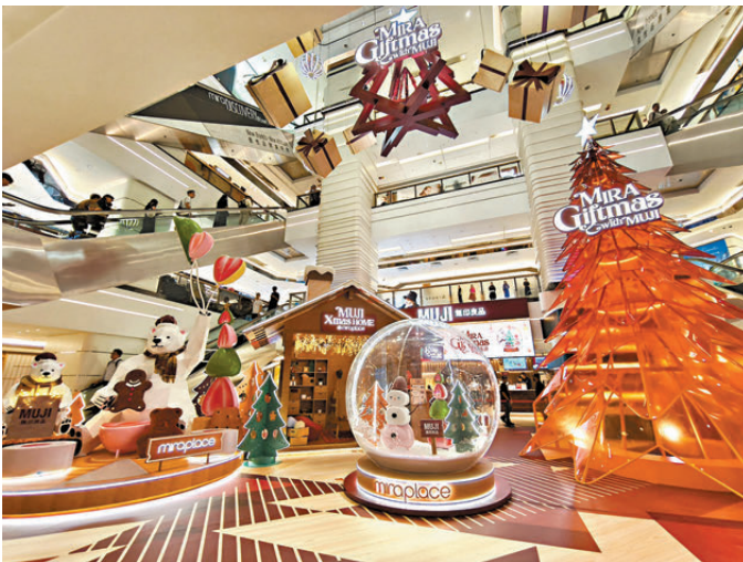
● 「Mira Giftmas with MUJI」夢幻聖誕小鎮