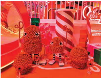
● 以絲帶設計的裝置