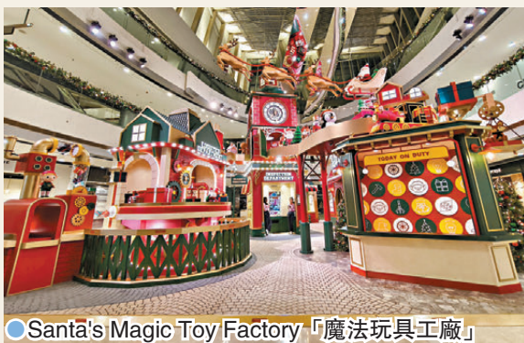
● Santa's Magic Toy Factory「魔法玩具工廠」