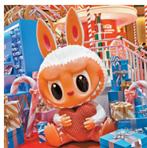
● 人氣角色 Zimomo